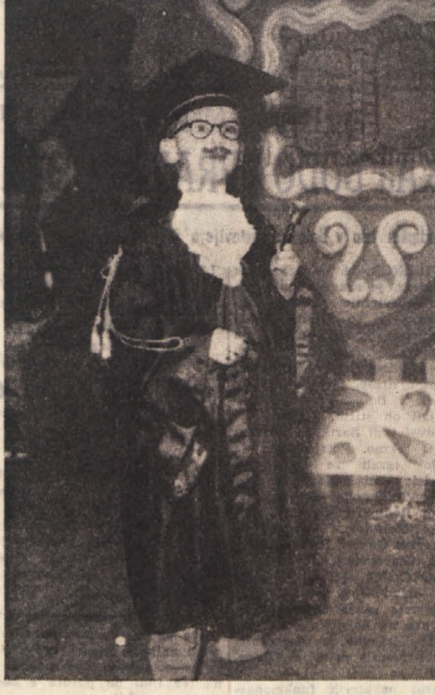
Nadej si je sodniško togo, toda le za pusta...