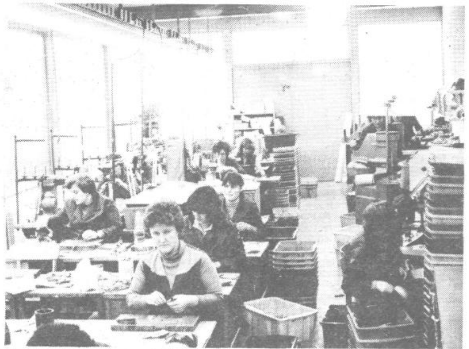
Za izgradnjo 200 kvadratnih metrov velike zgradbe ob matični stavbi na Mivki 25 so odšteli 12 milijonov dinarjev. Kljub večjim proizvodnim prostorom pa šivalnica še vedno ne more zadostiti zmogljivostim montaže zelo iskane modne ženske obutve.

Razmišljajo sicer, da bi povečali obrat v Mokronogu, že zaradi utečene osnovne delovne sile in velikega