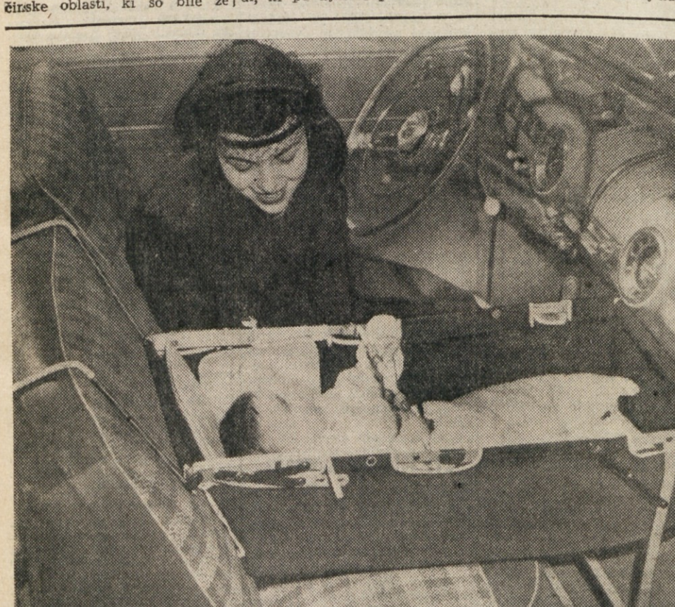
Ce je že avto, zakaj si ne bi manila lahko privoščila udobne vožnje z matim sinkom? Nekomu, seveda v Ameriki je sinita dobra misel v glavo in je sestavil priročno zibelko, ki se jo lahko postavi v vsak avtomobil. Najbrž mu je ta misel prinesla precej dobička.