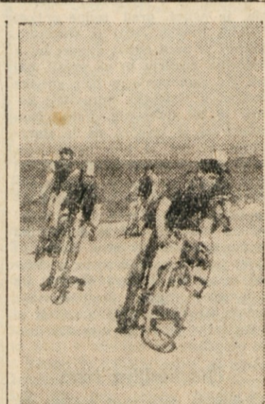
KOLESARJI SE NA OVINKU SKUSAJO ODRTIGATI OD JEDRA.

Sellier in Fontanot sta se v 17. krogu odtrgala od skupine in dosegla Donadela, ki je vozil v tretjo serijo tempo. Pri Vrabeču in Fontanotu se je pričela opaziti utrujenost. Posledica tega je bilo zaostajanje teh dveh.