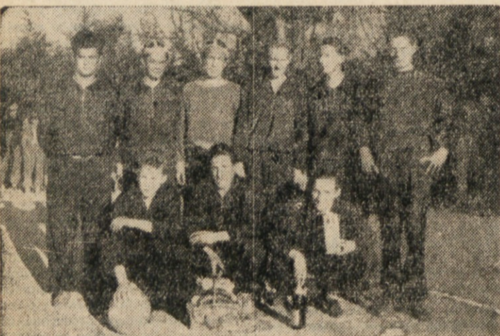
MOSTVO LJUBLJANSKIH SREDNJIH SOL.