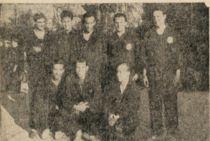
MOSTVO LJUBLJANSKE UNIVERZE.