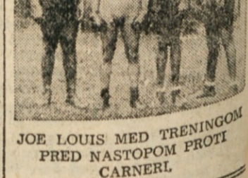
JOE LOUIS MED TRENINGOM PRED NASTOPOM PROTI CARNERLU

Na koncu Louis resignirano dodaja: «Kadar sem bil izven taborišča, sem ravnal po zakonih rasmega zapostavljanja. Misli pa sem si, da tega zapostavljanja vsaj v armadi, kjer se borimo vsi za isto stvar, ne bo».