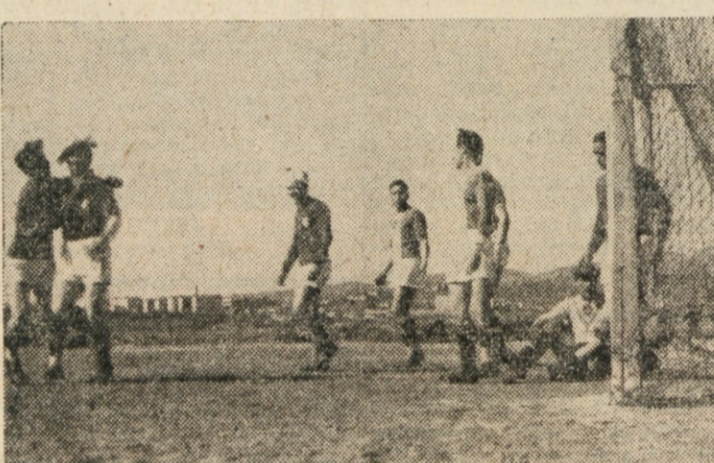
ARZENAL - VESNA 2:2 DRUGI GOL NAPADA VESNE.

Tovarna strojev ima že dolgo časa precej grdo navado, namreč prihaja na igrišča nepopolna. In prav to priliko je porabila Ponziana, da je, čeprav v zadnjih sekundah igre, odnesla Tovarni strojev vsaj za Ponziano važno točko. Tovarna strojev preide v