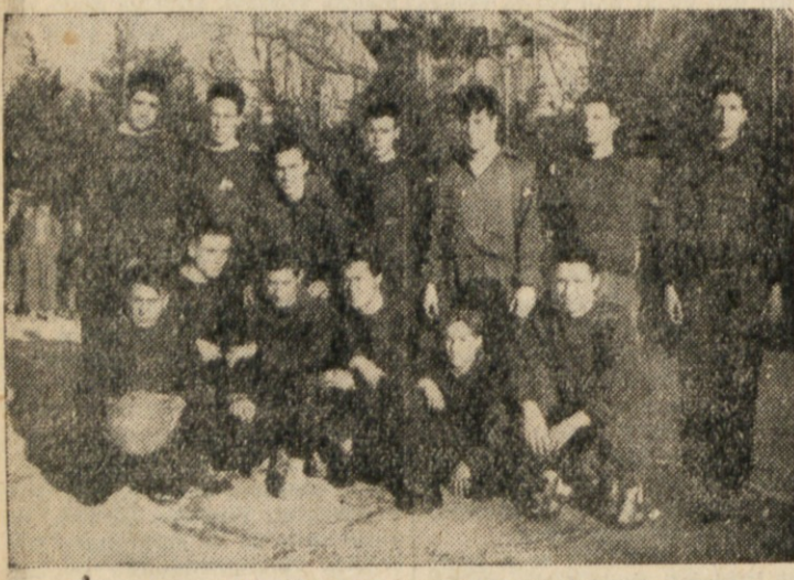
MOSTVO TRZASKIH DIJKOV.