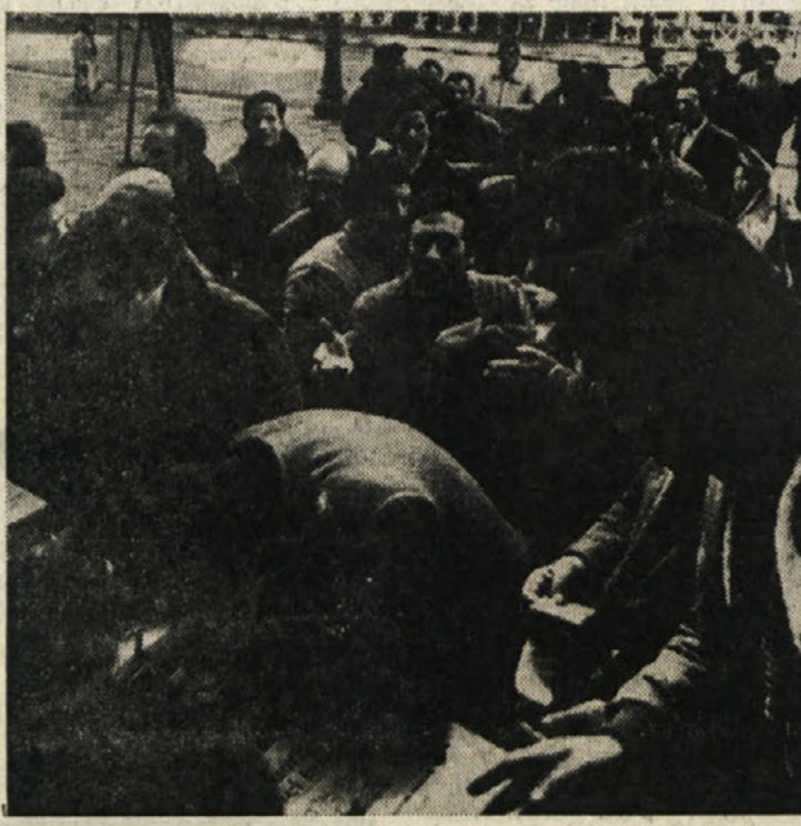
Pred Kolosejem so večeraj uspešno zbirali podpise za odpravo zakona, ki omejuje obračunavanje draginskih doklade za odpravine od 1. januarja 1977 dalje