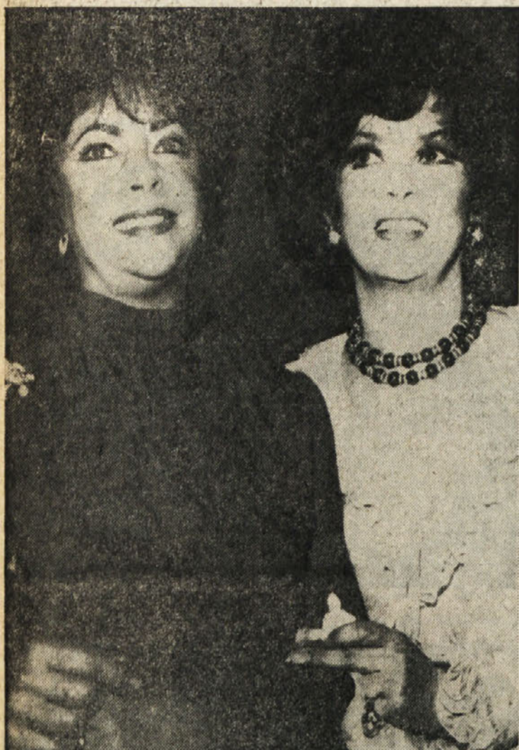
Liz Taylor in Gina Lollobrigida, ki ju poznamo iz cele vrste včasih celo zelo dobrih filmov, sta prispeli v newyorskimi Palace hotel, kjer so jima dodeli posebno nagrado, ki jo dodeli iz sklada, ki je bil ustanovljen že leta 1882. Kot vedo povedati, je italijanska obseglarica še vedno evlijnijs, vsem ko je Liz baje dokaj zaobljena