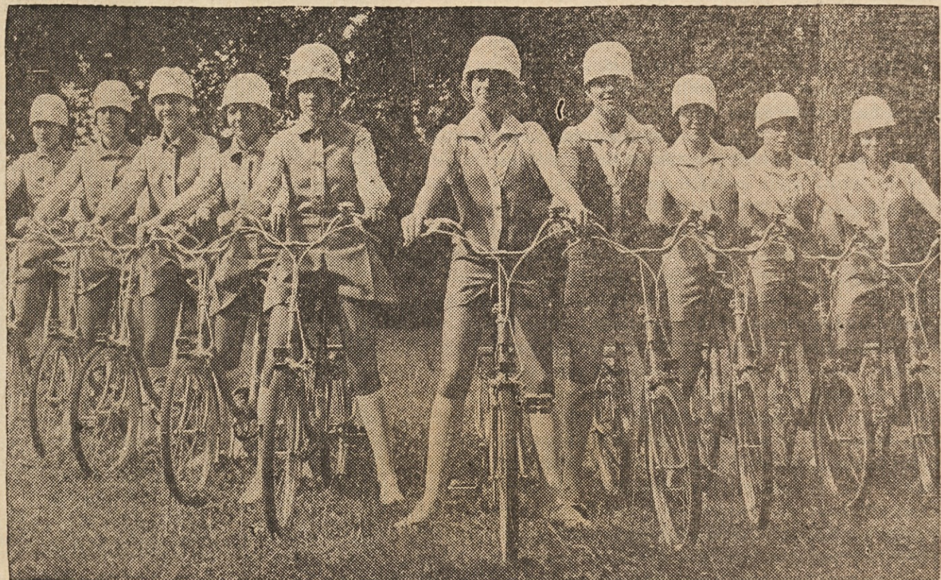
POSTAVIJO SE — Skupina kolesark v modro-oranžnih uniformah, za katere je izdelal krój Jacques Estrel, je vzbudila s svojim nastopom v pariškem Bois de Boulogne splošno zanimanje.