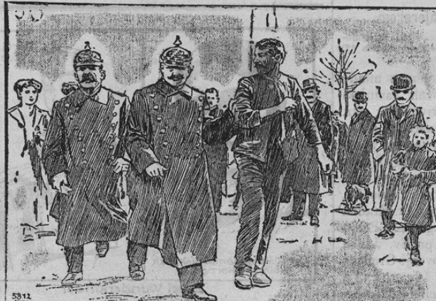
Verhaftung eines Anarchisten auf d. Friedhof d. Märzgefallenen in Berlin.