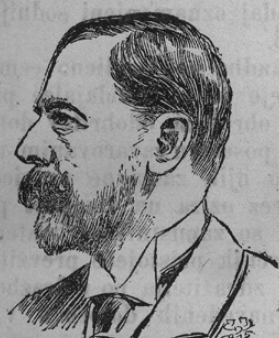
Leopold Graf v. Kolowrat-Krakowski

Poročali smo že v eni zadnjih števil, da je na Dunaju umrl Leopold grof Kolowrat-Krakovski. Sele 56 letnega moža je vrgla težka bolezen v grob (rak). Grof Kolowrat bil je vodja nemških agrarnih (kmetijskih) poslancev. Začetkom 80. let je ustrelil grof Kolowrat v dvoboju grofa Karla Aunersperg. Obadva sta se pote-