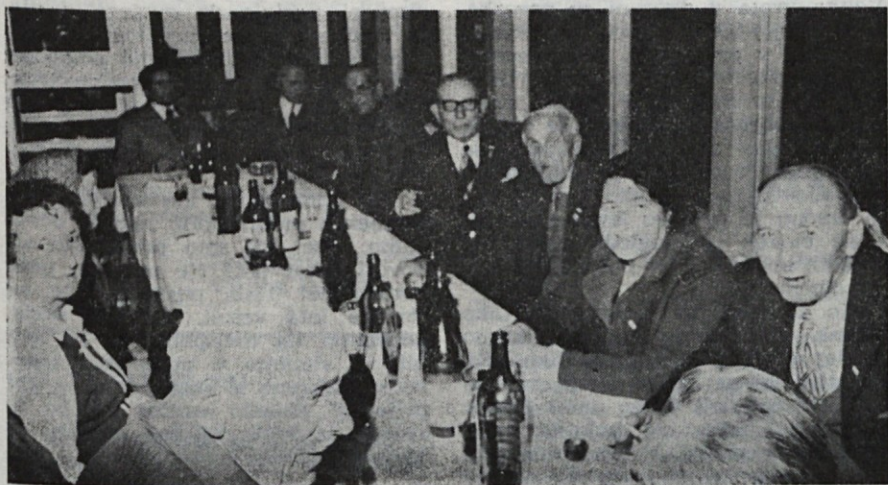
Zadovoljni obrazi, kot da govorijo: »pa le nismo pozabili eden na drugega!«