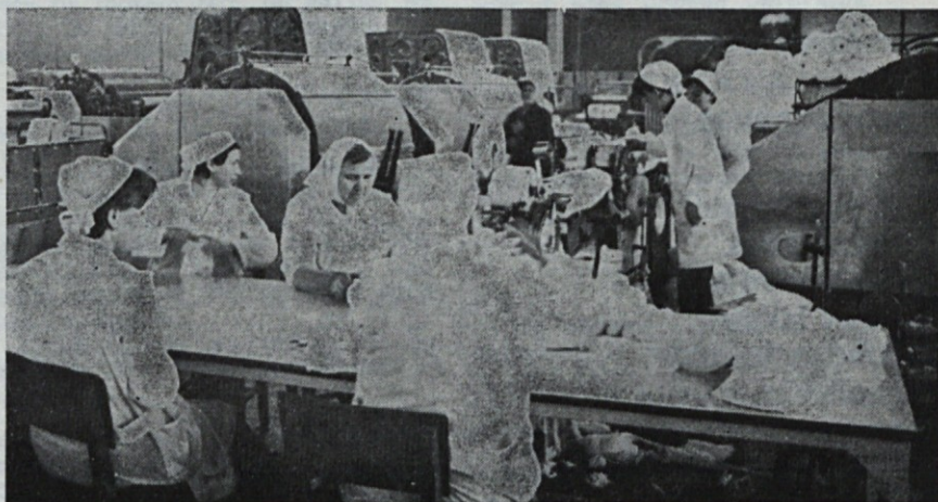
Bela, bela — vendar ne zima — ampak mikalnica

Nasprotno pa ne smemo komercialnega predstavnika, ki kvalitetno izvršuje zahtevano delo v korist tovarne in zadovoljstvo kupca, nagrajevati pavšalno in neosnovano kritizirati (zaradi nepoznanja nje-