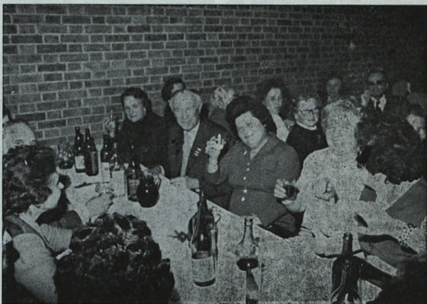
Na zdravje novemu letu in dobrim željam! Tej želji se pridružujemo tudi mi!