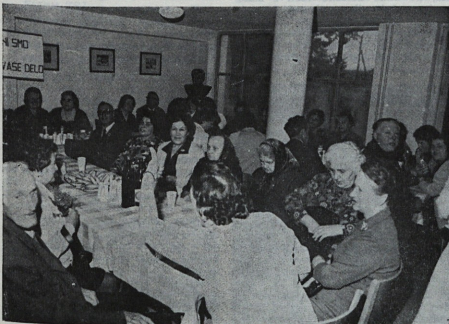
Toliko in še več vstrajnih Tosamovcev in Tosamovk bi težko kje našel zbranih skupaj

Skraj pol leta smo se dogovarjali kdaj, kako in kam? In končno smo si bili edini ker čas za nas upokojence ni pomemben faktor, da se uredi pred Novim letom. In res smo se odločili za potek, vendar ker je bil petek pa še 13. december, smo na hitro določili četrtek, kar je bilo