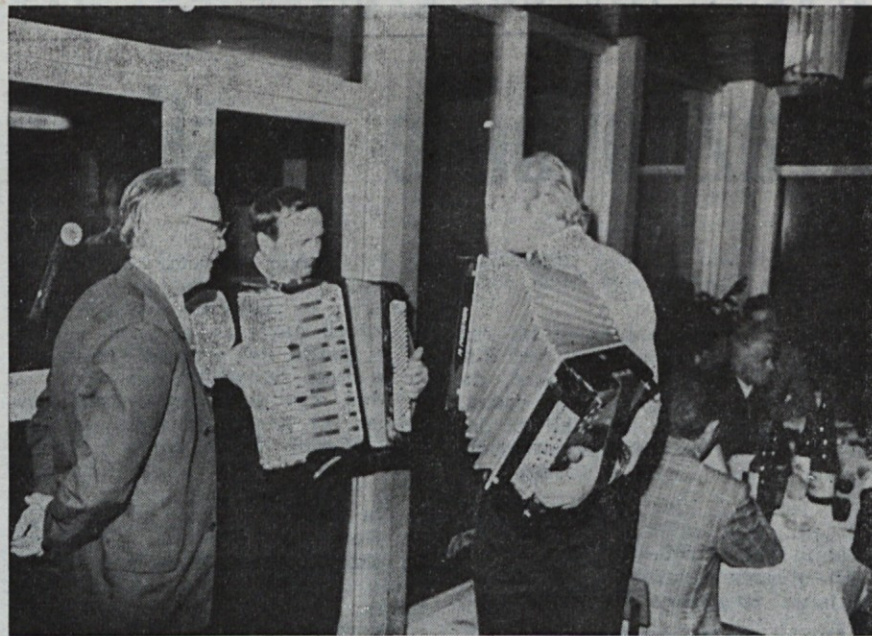
Potočnik s klavirsko harmoniko in Belcijan s »frajtonarico« sta lepšala razpoloženje

V tovarni imam še dve hčerki. Vedno mi morata »poročati« kaj je novega. Rada bi si ogledala vse novosti, ki jih uvajate. Večer je bil res čudovit.