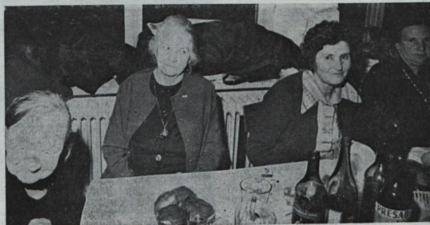
Jubilantkam pripada posebno častno mesto

Tov. direktor nas je res lepo sprejel. Tudi drugi so bili zelo pa-