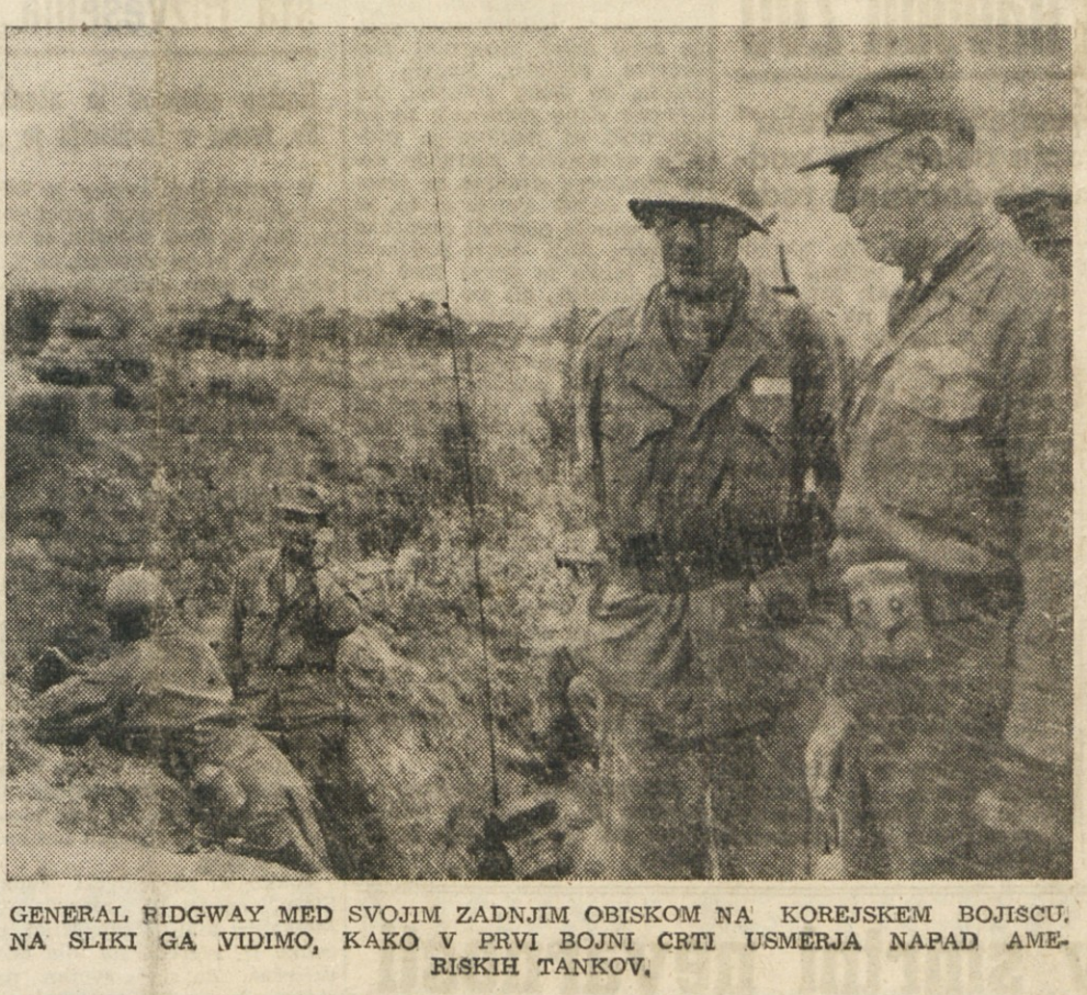
GENERAL RIDGWAY MED SVOJIM ZADNJIJM OBISKOM NA KOREJSKEM BOJIŠČU. NA SLIKI GA VIDIMO, KAKO V PRVI BOJNI CRTI USMERJA NAPAD AMERISKIH TANKOV.