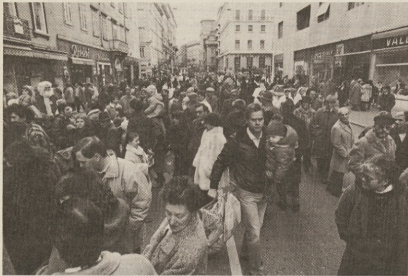
Velika gneča v nedeljo zjutraj na Korzu.