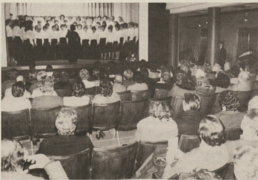
Skupni nastop štirih zborov v proseškem Kulturnem domu.

Ob koncu srečanja so trije zbori, ka- terim se je tokrat pridružil še ženski zbor KD Rdeča zvezda iz Saleža, skupno zaključili ta lep večer. Pod vodstvom Marte Werk-Volk so zdru- žene pevke občuteno, lepo in mogočno zapele Pahorjevo »Pesem žena« in Gobčevo »Zapojmo pesem«. Prav pe- sem, posvečena ženi, je kot zadnja za- donela na večeru, ki je v ponos in veselje pevkam, njihovim zborovod- jem, pa tudi vsej naši slovenski skup- nosti. (N. L.)