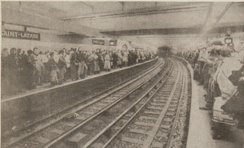
Parižani vztrajajo in upajo (dum spiro, spero), da bo kljub stavki uslužbencev metrója, iz tunela le prikukal vlak