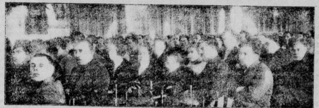
Slika iz zadnjega kongresa ruske komunistične stranke v Moskvi, na katerem so obsodili Trockega.

Presenetljivo hitra rast raslin v tropskih krajih je znana. Vse predstave o rapidni rasti pa prekaša poročilo, katere objavljaja glavni urednik »Bulletina of the Pan-American Union«, Franklin Adams v svojem listu. Neko, za obnovitev določeno deblo banane je bilo ob 10 jutraj gladko odsekano blizu tal. 20 minut pozneje se je ploskev, kjer je bilo deblo odsekano, že spremenila: sredi nje se je dvignila 2 cm visoka mladika, ki je obstojala iz tesno skupaj stisnjenih peres. Mladika je tako hitro rasla, da je še isti dan ob 6 zvečer, torej osem ur pozneje, dosegla višino 72 cm. Naslednji dan ob 5 popoldne se je njena velikost podvojila; palma je stala v vsej svoji krasoti z raz-