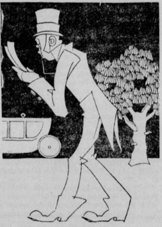
1828: Nekaj strani zadostuje. —

hajalo v Evropi. Po vojni je val še narastel. Kot drugod so tudi tu zavzele prvo mesto Združene države severne Amerike; število perijodično izhajajočih listov se približuje že 30.000. V Evropi je še vedno na prvem mestu