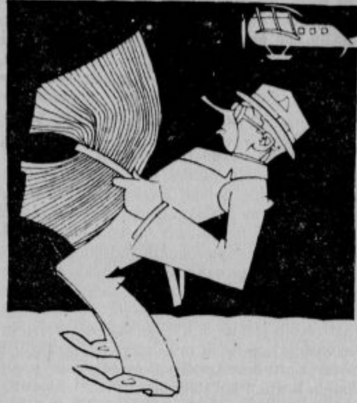
2028: Samo 1000 strani. —

Temu primeroma so se okrepile tudi časopisne agenture. Londonski Reuter, ki je veljal