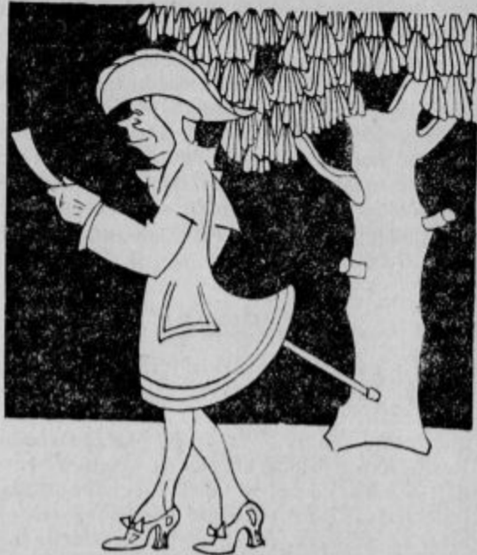
1728: Zadovoljen sem z eno stranjo. —

Hanns Nickel je cenil število listov in glasil v letu 1915 na 80.000; 43.000 od teh je iz-