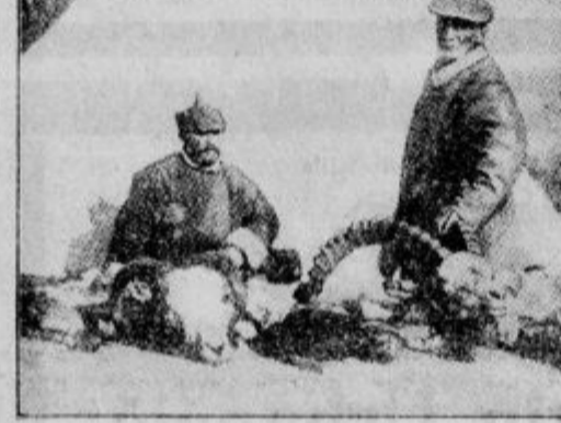
Kozlov sloveči ruski raziskovalec Mongolije (na levo), ki je odkril grob Džingis kana na Altaju. Na sliki vidimo Kozlova s svojim pomočnikom poleg dveh ubitih lepih eksemplarjev gorskega kozla.