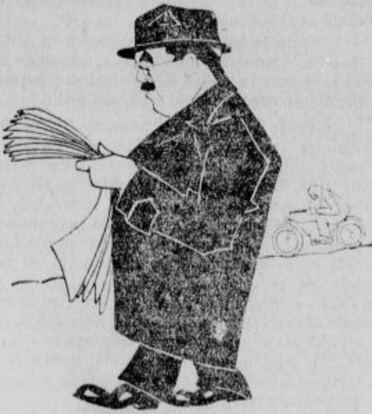
1928: Veliko je, a vsaka stran me zanima. —

Nemčija s 3500 dnevniki in 4500 strokovnimi listi. Poplavo si lahko predstavljamo, če navedemo, da je v tej državi okrog 150 milijonov abonentov, da se razpošljejo letno milijarde listov.