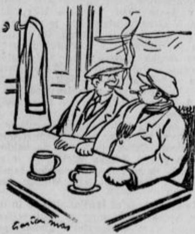
— Ali mi ta površnik pristojno dobro? — Da — se — — Se ne!

VREDNOSTNI PAPIRIJ. Dunaj Podon.-savska-jedr. 88.65, Zivno 113.75, Hrv. esk. 6.40, Jugo 11.80, Hipo 7.80, Alpine 42.85, Trbovlje 67.70, Kranjska industr. 41, Ruše 35, Munds 170.