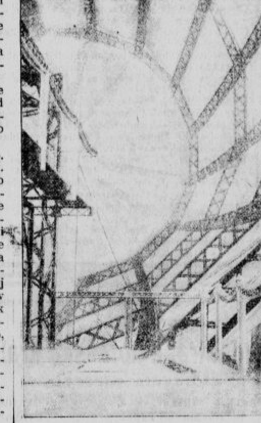
Notranjščina orjaškega zrakoplova ki bo plul med Londonom in Newyorkom preke Montreala in bo napravil svojo turo v 86 urah tj. in nazaj.

Katoliška univerza v Pekinu je dobila državno odobrenje in priznanje naučnega ministra kitajske vlade. To je prvi slučaj v zgodovini kitajske, da je katoliški zavod za višjo izobrazbo vlada javno priznala. Vski dobe lastno nadškofijo. V slovaških krogih so se že splošno zedinili, naj bo sedež nove nadškofa Bratislava. Nadškof naj bi dobil za svojo rezidenco palačo bivškega nadvojvode Friderika. Kot oseba, ki ima največ upanja, da zasede nadškofovski stolec, se imenuje slovaški škof K. Ameko.