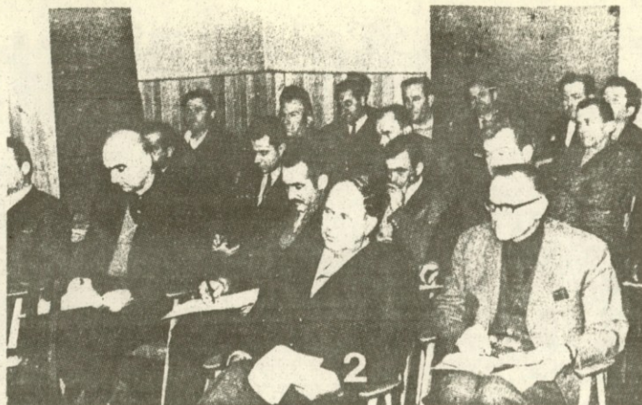
NA SEMINARJU 8.1.1970