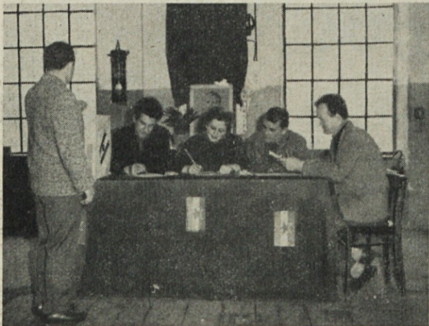
Volitve novega delavskega sveta (z volišča službe vzdrževanja)