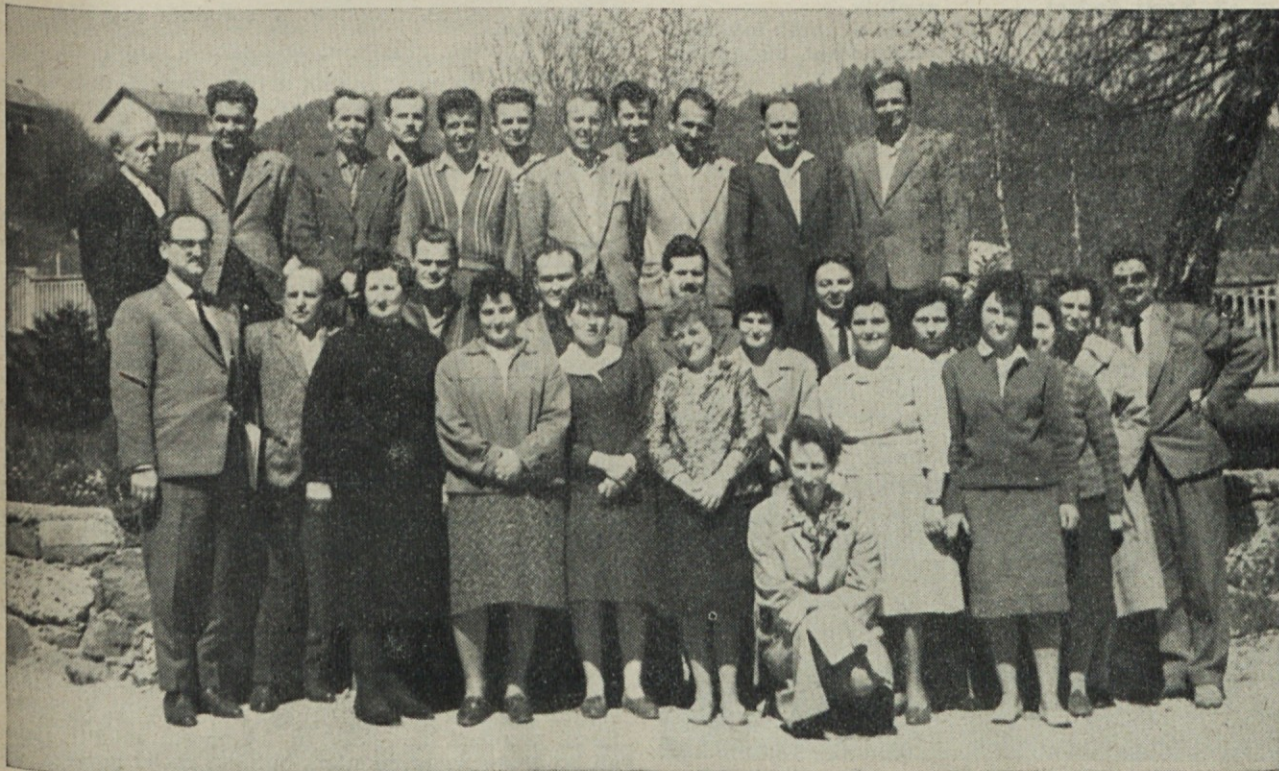
Novoizvoljeni delavski svet