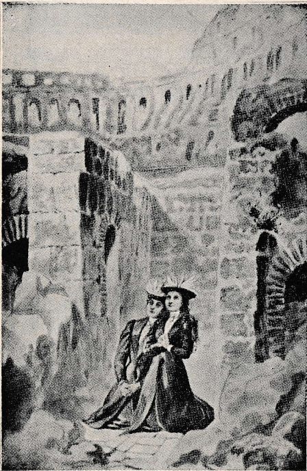
Rim: „Pokleknili sva na posvečeno zemljo in najini duši sta se združili v vroči molitvi ...“

Drugače se je pa z vsem mladostnim ognjem udeleževala ogle- dovanja svetega mesta. Nastanili so jih v „Hotel del Sud“ v ulici Capo le case. Leta 1925, ob proglašenju Terezike svetnicam, so vzi- dali v pročelje lepo spominsko ploščo.