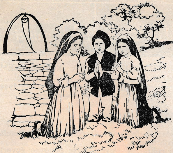
Fátimski pastirčki molijo rožni venec: „...za grešnike, da ne pridejo v pekel“.