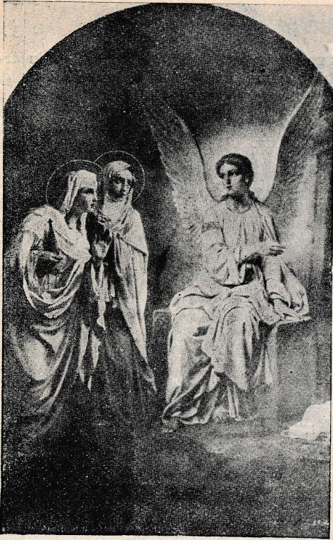
Vstal je Gospod! Vstanimo še mi!

veruje. Stanko je odšel, njegova visoka in lepa postava je zginila med vrati, Ofka pa je skrila svoj obraz med dlani.