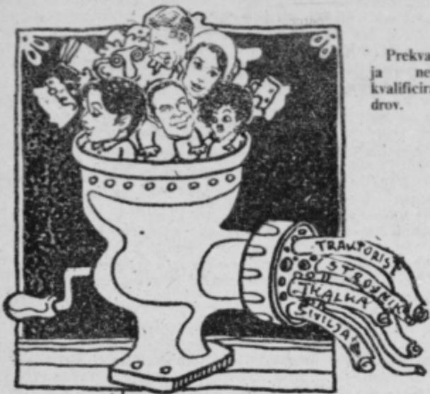
Prekvalifikacija neustrezno kvalificiranih kadrov.