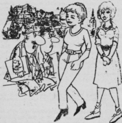
— Ker vedno nosim hlače, polovico ptujskih dedcev misli, da sem fant. — No ja, zato pa se je najbrž druga polovica že lahko prepričala o nasprotnem.