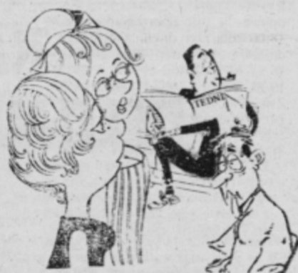
Pravijo, da je v Tedniku zato tolikokrat kak goli vic, ker si na ostalih straneh ne upajo vedno zapisati gole resnice.