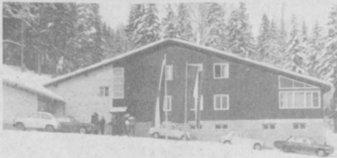
Osankarica, čeprav zasnežena bo tudi letos ob prazniku zbirališče številnih občanov, predvsem pa mladine in borcev NOV.