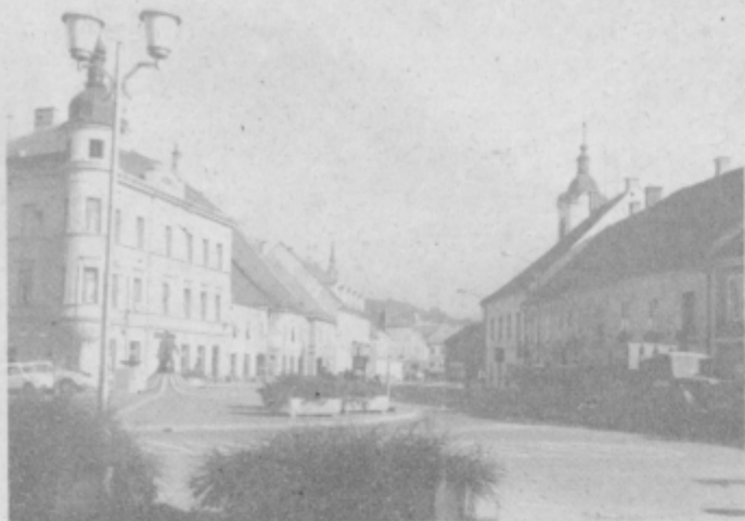
Občinsko središče v pričakovanju praznika v spomin na 40. obletnico poslednjega boja legendarnega Pohorskega bataljona.

GLASILO SOCIALISTIČNE ZVEZE DELOVNEGA LJUDSTVA