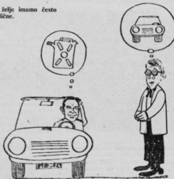
Tudi želje imamo često zelo različne.