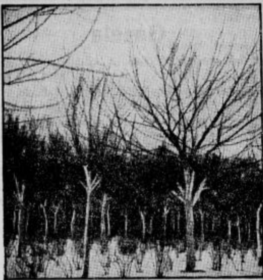
14 letni visokodebelni nasad, vmes grozdčijnice in češnje.

Vsak sadjar naj se odloči le za tri ali štiri, pri obširnem nasadu za pet ali šest glavnih sort. Potem naj sadi in preceplja dosledno in vztrajno samo te sorte vse do tje, da bo imel vse drevje v svojem sadovnjaku v maloštevilnih izbranih sortah. (V drugih državah so v tem oziru še bolj radikalni, ker imajo v sadnem izboru samo po 3 vrste jabolk.)