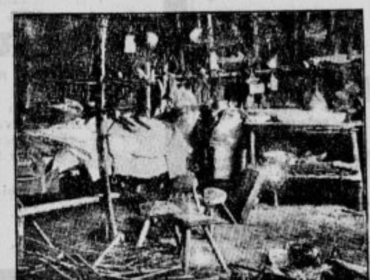
kakor jih prinašamo na teh dveh slikah, do junarja t. l. Tega meseca so kolibe sežgali in naselili ljudi v lične hišice, ki jih je zgradila »Opera nazionale Combattentia«. Pa v Italiji, pravijo, je še veliko takih in podobnih brlogov.