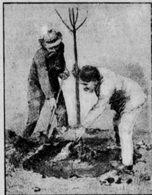
Pravilno sajenje mladih dreves: eden drži drevesce v pravi višini, drugi sipa rahlo zemljo med korenine.

Izbira sort, katere edine naj se razmnožujejo in goje po posameznih okoliših, je pa težaven posel, ker zahteva dolgotrajne izkušnje in poznavanje raznih pogojev za uspešno gojitev te ali one sorte. Da se posameznemu sadjarju delo olajša in doseže potrebna enotnost, so sestavili sadjarski strokovnjaki v sporazumu s preizkušnimi praktiki pripomoček za izbiro sadnih sort, to je seznam vseh tistih sort, ki so prikladne za naše kraje, posebno glede podnebja in zemlje. Z navajanjem golih imen pa ne bi veliko dosegli, posebno ker so imena sadnih sort tujca. Zato je Sadjarsko in vrtnarsko društvo ravnokar izdalo knjigo: »Sadni izbor za Slovenijo v besedi in sliki«, kjer priporočene sorte niso samo natančno opisane, ampak tudi naslikane v naravnih barvah. V tej knjigi je opisanih in naslikanih 20 sort jabolk, 10 sort žlahtnih hrušk, 3 sorte češenj, 3 sorte sliv in češpelj, 3 sorte breskev in 1 sorta marelic. Opisane so pa tudi najboljše sorte jagodastega in koščičastega sadja: