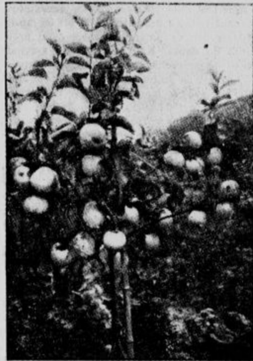
Jablana — Veliki vojvoda Friderik — v obliki grma.

Pri sadjarstvu smo tudi v tem oziru jako zaostali, dasi dobro vemo in vsako leto bridko izkušamo, kako ogromne množine sadja nam vražji škodljivci ali popolnoma uničijo ali pa vsaj tako oškodujejo, da za trgovino nimajo nikake vrednosti. Tuintam posameznik še stori kaj malega, toda splošnost se še ni zganila, dasi marsikje že »teče voda v grlo«. Doslej se je sadno drevje samo hranilo kolikor toliko uspešno, toda odpornost pojema in nekatera sadna plemena so na robu propada (češnje, breskve, češplje). Treba je torej seči po od pomoči, kakor se je to že zdavnaj zgodilo pri vinski trti. Sredstev za preganjanje in zatiranje zajedalcev imamo na izbiro. Že leta in leta se priporoča škropljenje sadnega drevja z arborinom, ki uničuje razne žuželke. Obenem pa je obrambeno sredstvo proti raznim glivičastim boleznim. Koliko pa imamo šele raznih preizkušenih sredstev za zatiranje posameznih škodljivcev, bodisi živalskega ali rastlinskega rodu. Izmed vseh so najvažnejša tobačni izvleček, modra galica in žveplo v raznih oblikah. Manjka pa splošnosti potrebne uvidnosti in odločnosti. Prepričanje, da brez smotrnega in vztrajnega zatiranja sadnih škodljivcev, sadjarstvo nima bodočnosti, žalibog še ni prodrlo dovolj globoko v sra naših sadjarjev. Velika večina misli, da bo šlo tudi brez tega in da je vse odvisno od letine. Kako napačno pa je tako mnenje, nam dovolj jasno izpričuje vinska trta in propadanje češnjevega in češpljevega drevja. Kaj ko bi bile sedaj na