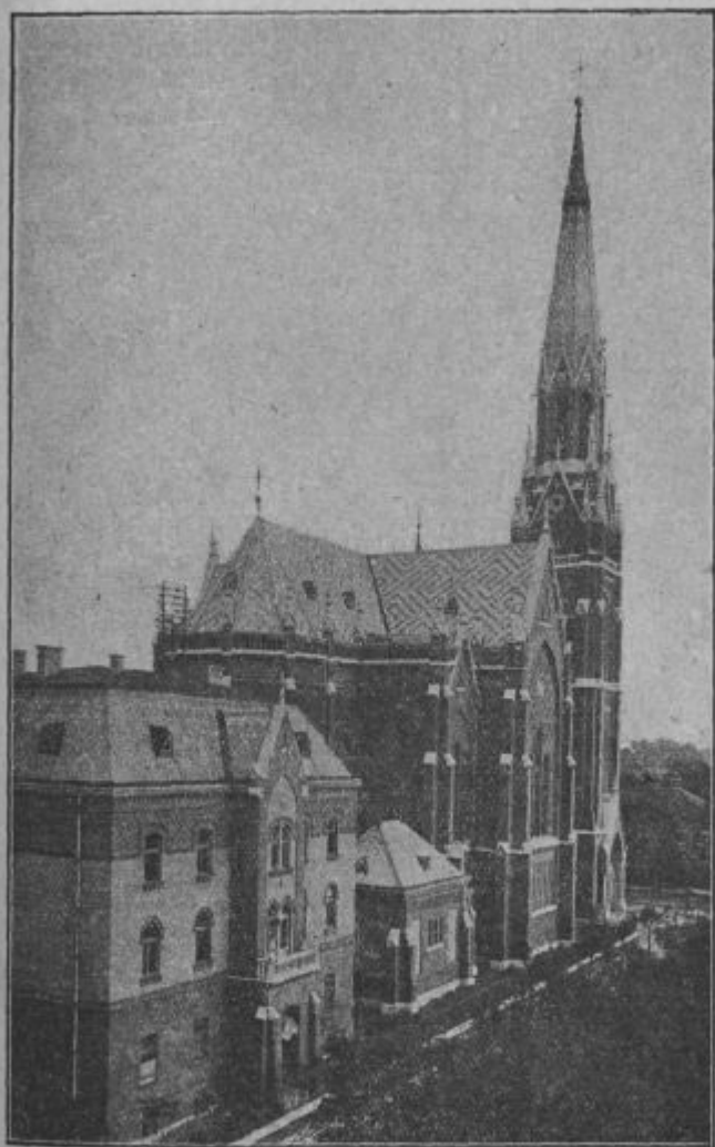
Rožnovenska cerkev i samostan dominikancov v Budapesti.

tá miseo, ka ne do meli več prilike Bogá razžaliti! Oh kak velko veselje je stisnoti v zádnoj vöri razpetjé ino zadovolno šepetati z oslablenimi vüstami: »za volo toga bom v míri počivao!»