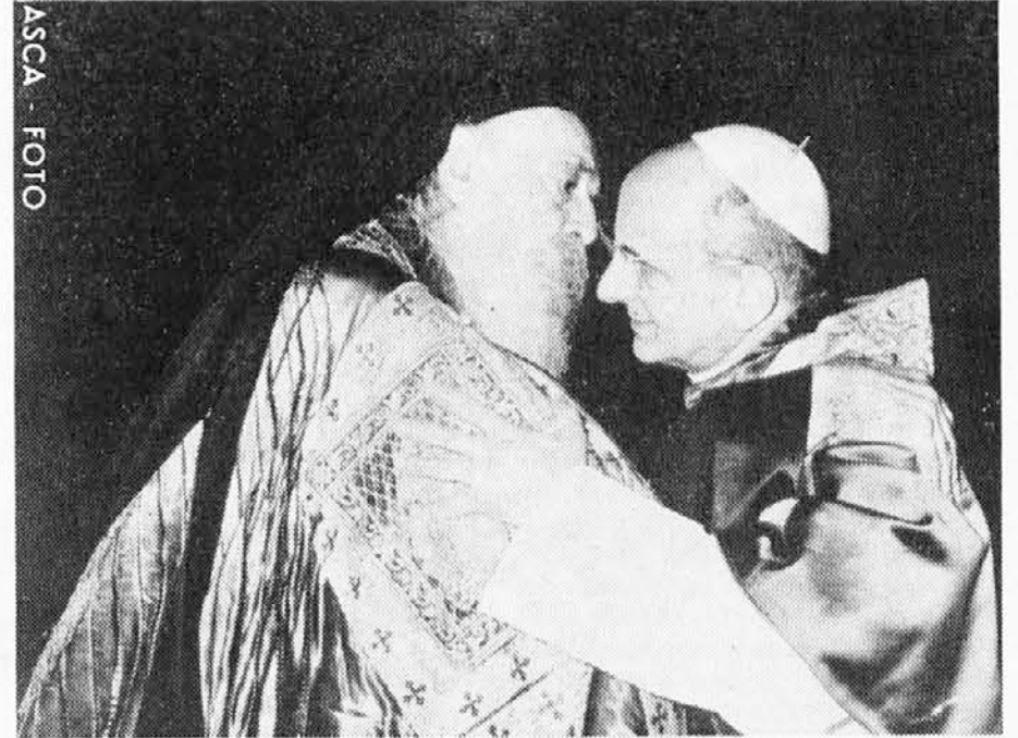
Zgodovinski objem papeža Pavla VI. in patriarha Atenagora leta 1964 v Jeruzalemu

Rodil se je leta 1886 v grškem Epiru, ki je bil tedaj še turška provinca. Leta 1923 je postal škof na otoku Krfu, leta 1934 pa je bil poslan v New York, kjer je prevzel vodstvo grške pravoslavne škofije za vso Severno in Latinsko Ameriko. V stiku s katoličani in protestanti je v njem dozorel tisti ekumenski duh, ki je v zadnjih desetih letih prišel do izraza zlasti v stiku s papežem Pavlom VI. Leta 1948 je bil izvoljen za patriarha