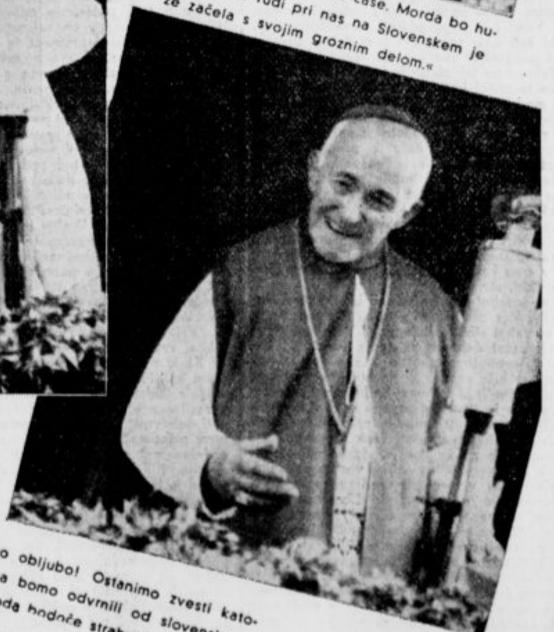
»Držimo krstno obljubo! Ostanimo zvesti katolički Cerkvi, pa bomo odvrnili od slovenskega naroda hrdne strahote!«