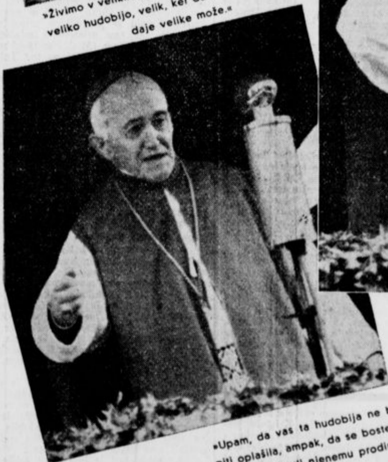
»Upam, da vas ta hudobija ne bo niti zapeljala niti oplašila, ampak, da se boste z vso krepostjo uprli njenemu prodiranju.«