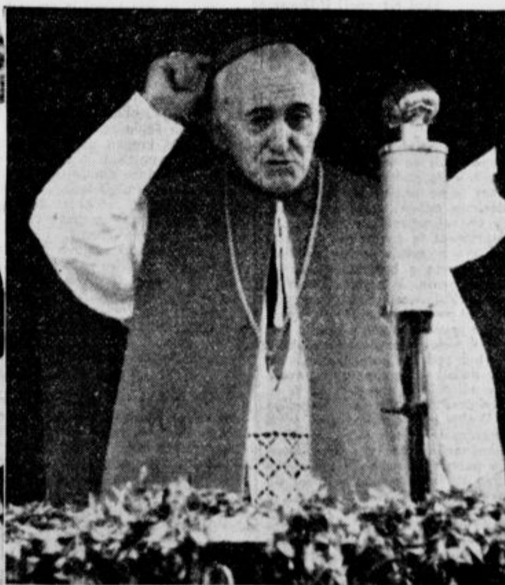
»Satan ima že svojo fronto! Pa ima tudi Kristus svojo fronto! In ta fronta bodite vi, može in fantje!«