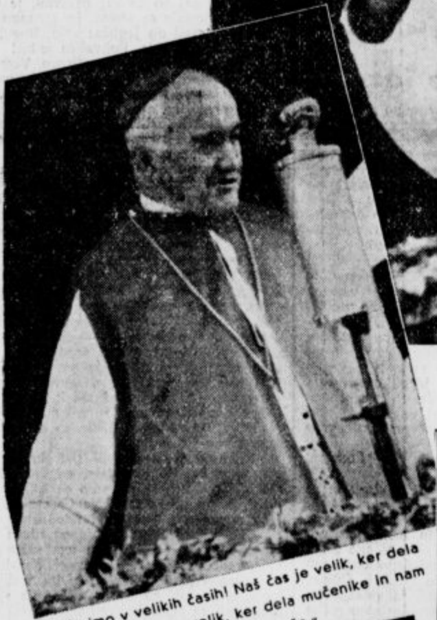
»Živimo v velikih časih! Naš čas je velik, ker dela veliko hudobijo, velik, ker dela mučenike in nam daje velike može.«