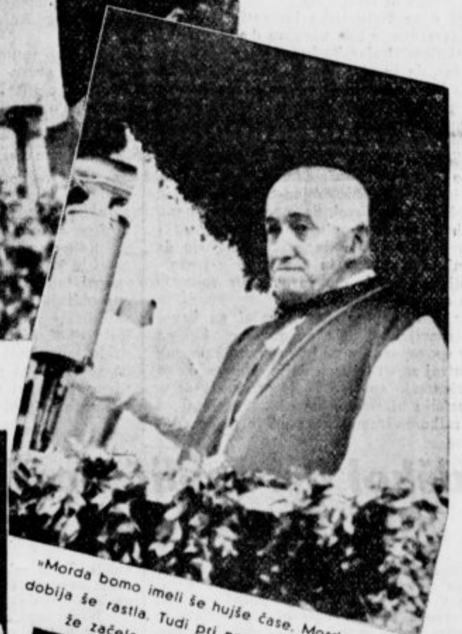
»Morda bomo imeli še hujše čase. Morda bo hudobija še rastle. Tudi pri nas na Slovenskem je že začela s svojim groznim delom.«