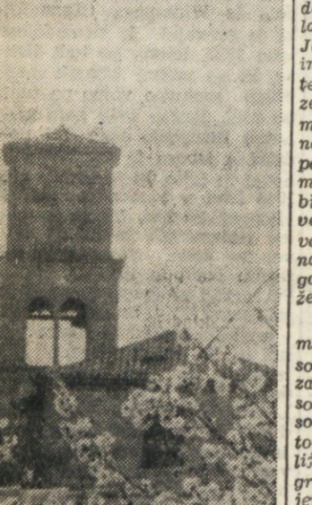
Tako je v Istri prihajala pomlad