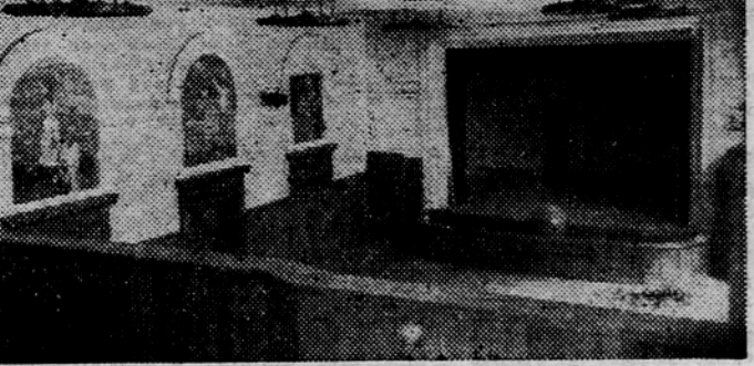
Pogled v dvorano za pridelitve v zadrugskem domu na Bizeljskem