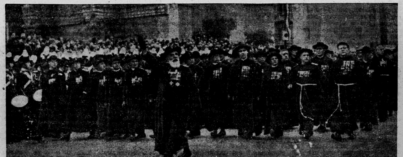
Na neki proslavi obletnice »pohoda na Rim«, defilirajo duhovniki — pripadniki fašistične milice, pred Mussolinijem. Razumljivo je, da so to tudi danes Vatikanovi »elitni oddelki« v borbi proti svobodi, neodvisnosti in napredku človeštva.