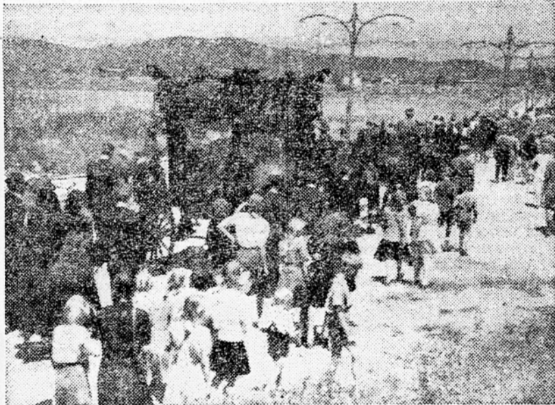
Mladina spremlja Otona Zupančiča na zadnji poti preko Ljubljanskega polja

Vse to je Zupančič vedel od prvega dne Osobodilne fronte, vse to je priznaval in želel od prvega dne, in to ne samo kot patriot, temveč tudi kot visokoumen mislec in ocenjevalec življenja. Zavedal se je, da bo zmagala odpora, zmagala Komunistične partije v enem zamahu postavila i njegov narod i narode Jugoslavije v vrsto najnaprednejših narodov sveta, v vrsto tistih občestev, v katerih se snuje in