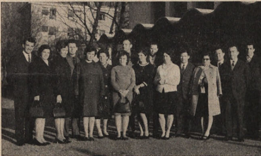
SKUPINA DELAVCEV, KI VAM JIH PREDSTAVLJAMO, PRAZNUJE V NAŠEM PODJETJU ŽE DRUGI JUBILEJ — 15-LETNICO DELA: