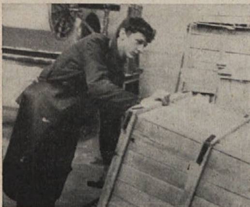
DELAVEC JE PRIPELJAL PREJO ZA PREVIJANJE