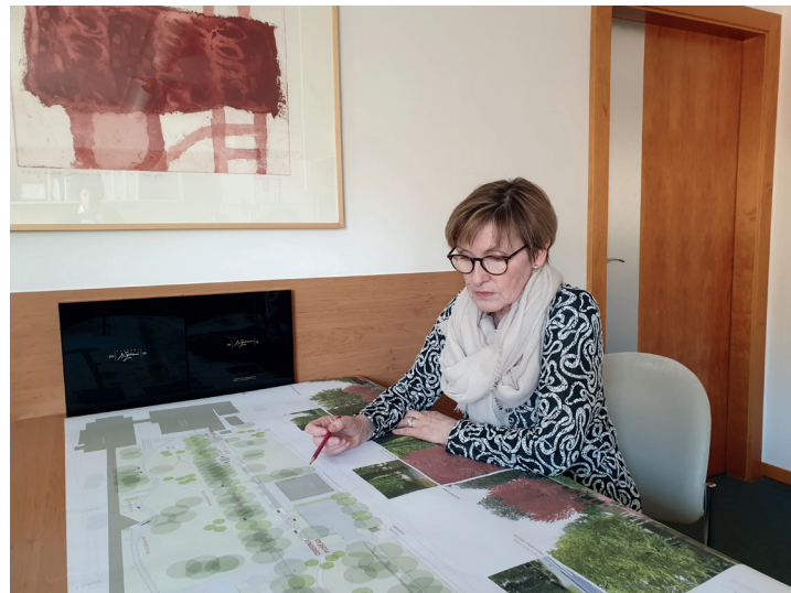
V delovnem okolju

bo to nadaljevalo – pa se seveda ni. Ob izdelavi občinskega prostorskega načrta za Novo mesto v letih 2006–2009 se nam je ponekod dogajalo podobno. Prostorsko načrtovanje je neke vrste napovedovanje prihodnosti, in vizionarstvo je odvisno tudi od razmer, splošnega razpoloženja in vrednot v družbi.