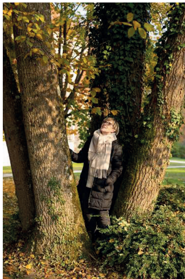
Drevesa ... in medias res