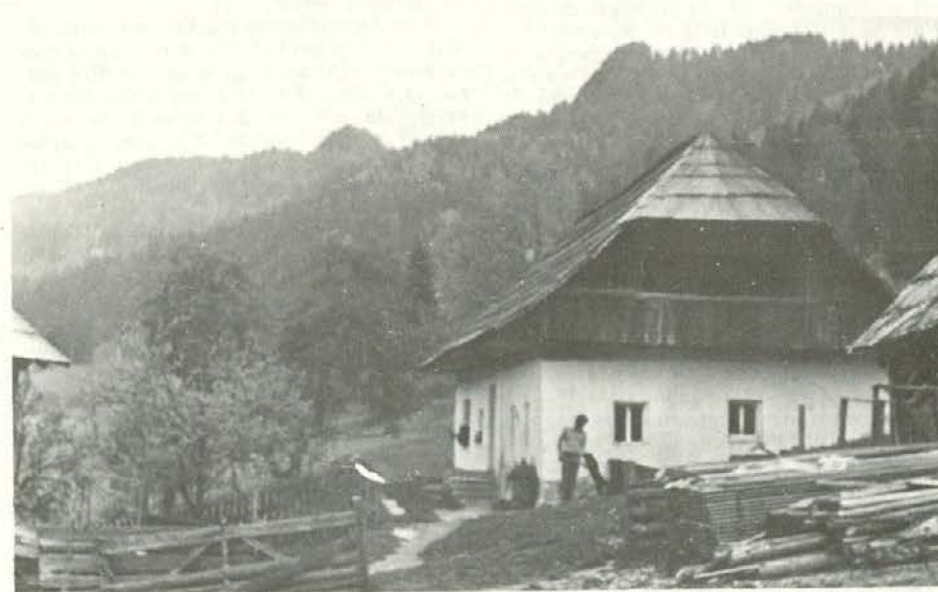
Domačija Plaznik v Bistri, foto: Matevž ČARF