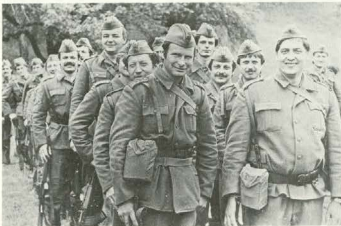
Bili smo na vojaških vajah