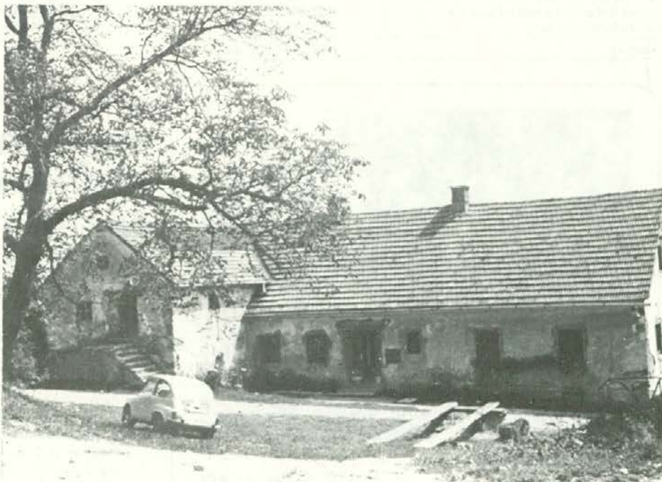
Kmetija DESETNIK v Danijelu pri Trbonjah