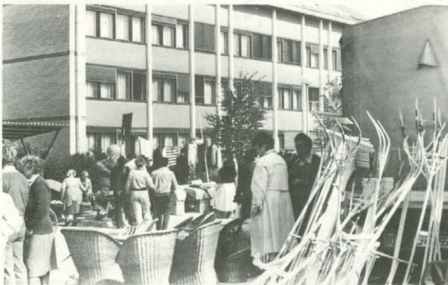
Odkar v Slovenj Gradcu gradijo novo tržnico, so se prodajalci zelenjave in druge robe naselili kar okrog stavbe slovenjegraške občinske skupščine.