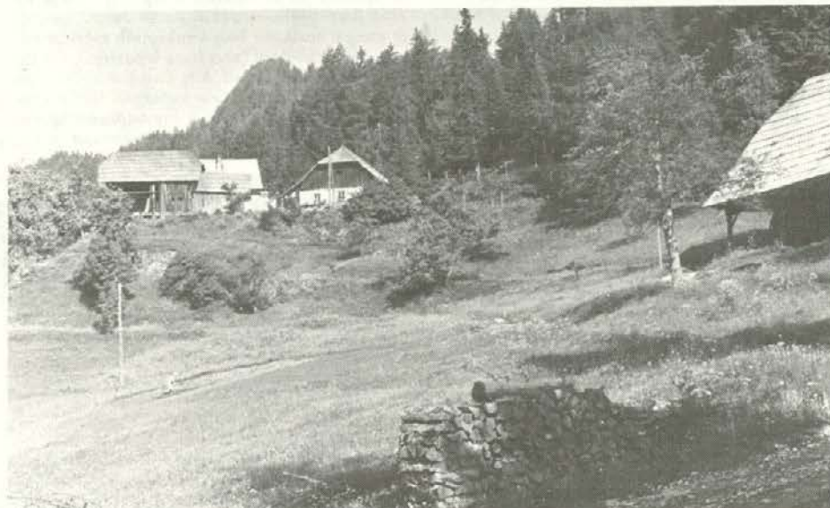
Domačija Prevržen v Bistri