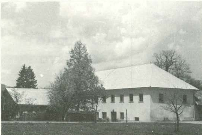
Krebsovo v Šmartnem