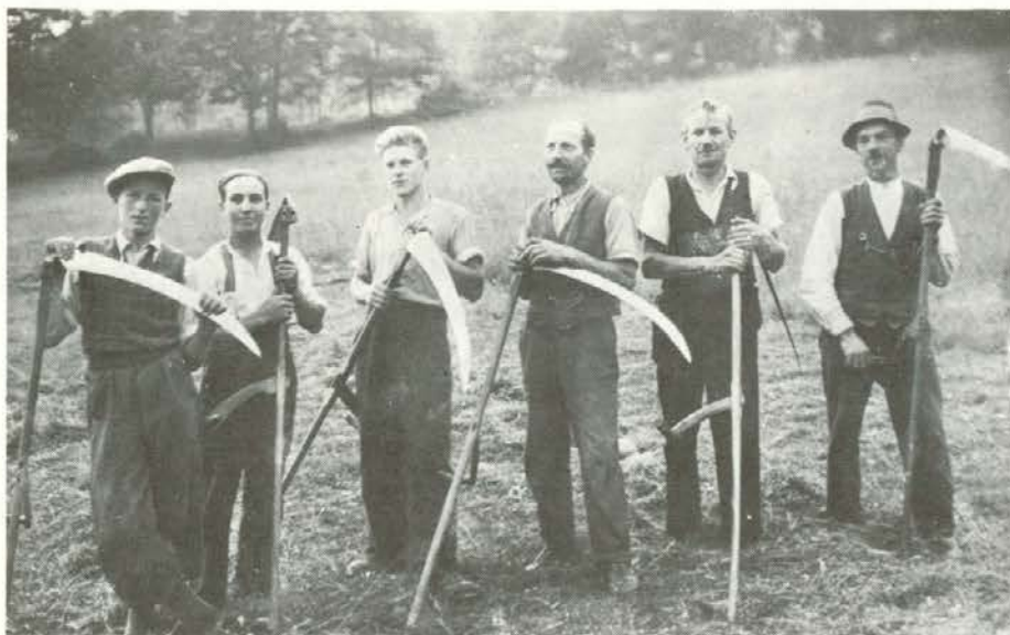
Kosci pri Rozmanu v Šentilju