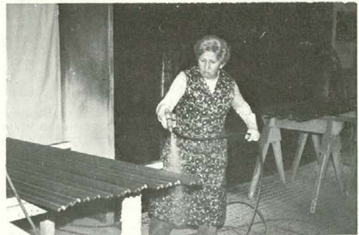
Brizganje okrasnih letev v TP Prevalje

Zaradi zmanjšane obsega vlaganj v gozdne prometnice letos ne bomo združevali za gradbeno mehanizacijo.