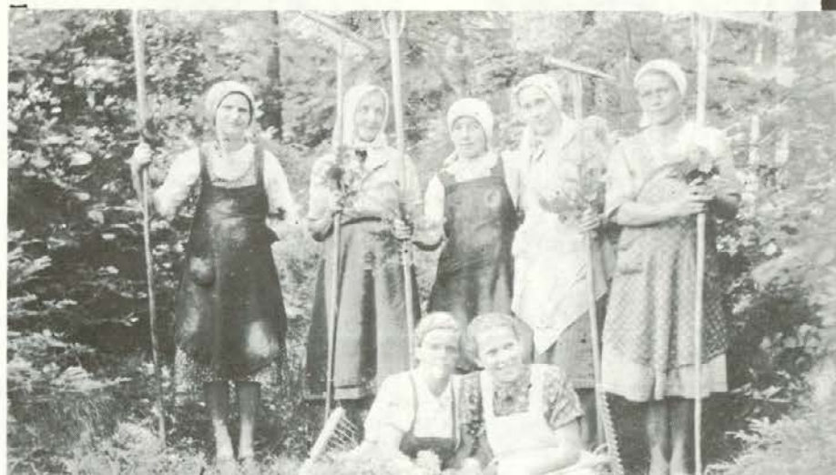
Rozmanove grabljice v Šentilju