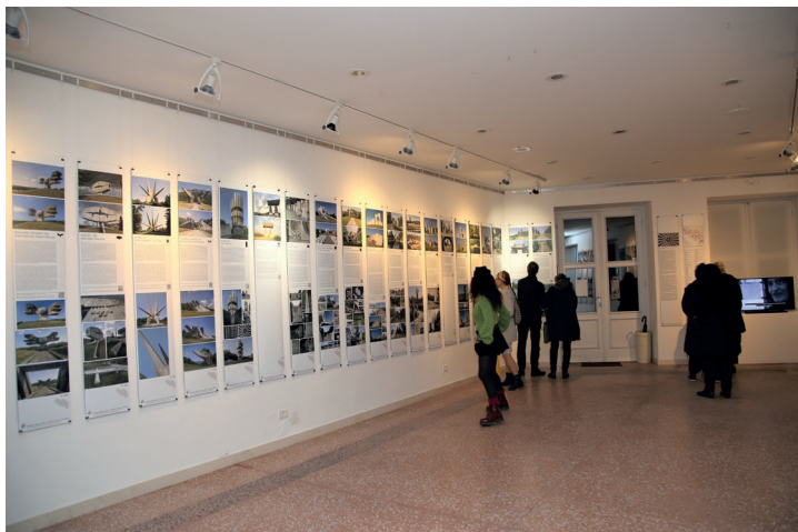
Odprtje razstave Arhitektura. Skulptura. Spomin. Umetnost spomenikov Jugoslavije 1945–1991. v galeriji Herman Pečarič v Piranu v okviru PDA 2019