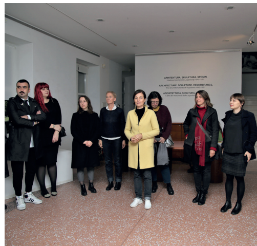
DESSA ekipa v galeriji Herman Pečarič na odprtju razstave spomenikov, november 2019

modernizma. Zaradi premajhne časovne oddaljenosti od njenega nastanka Zavod za varovanje kulturne dediščine Slovenije še ni imel oblikovnih parametrov njene zaščite, zato je bilo v prvih dvajsetih letih po osamosvojitvi Slovenije, v obdobju najbolj divjega tranzicijskega kapitalizma, veliko modernističnih stavb porušenih, neprimerno prenovljenih in prisiljenih v neprimerno vsebino. Danes vse več ljudi razume, da je za naše korenine nujno ohranjanje kulturne in arhitekturne dediščine.