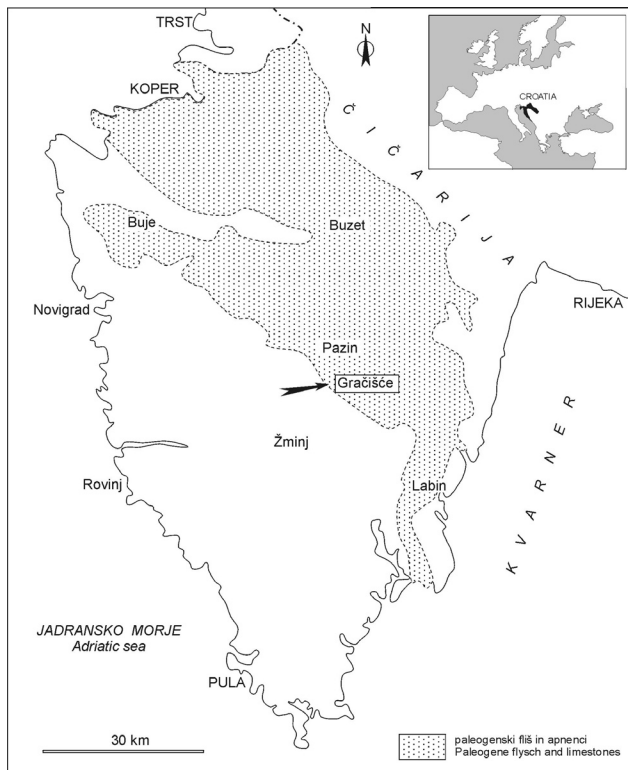
Slika 1. Geografski položaj najdišča Gračišće pri Pazinu v Istri, Hrvaška