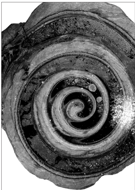
Slika 2. Ekvatorialni prerez hišice oziroma vzdolžni prerez spiralno zavite cevi eocenskega poliheta vrste Rotularia spirulaea (Lamarck, 1818) s parabolično in poševno teksturo. Gračišće pri Pazinu v Istri, x 5,7

Višina ali debelina hišic (Height or thickness of shells) = 4–5 mm