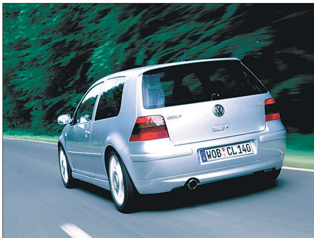
Golf — odslej tudi iz Sarajeva

Tekoče trakove so v Sarajevu ustavili leta 1992, ko je bila tudi na tem območju vojna.