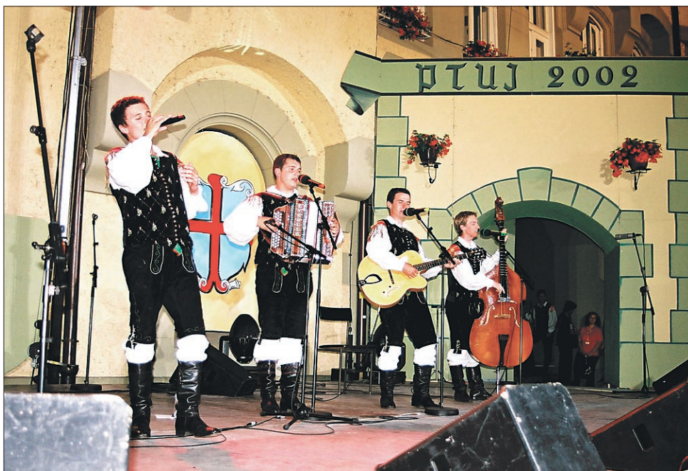
Dvojni zmagovalci 33. festivala - člani ansambla Modrijani - so prejeli prvo nagrado občinstva in Korenovo plaketo za najboljšo vokalno izvedbo. Več o festivalu na strani 3.