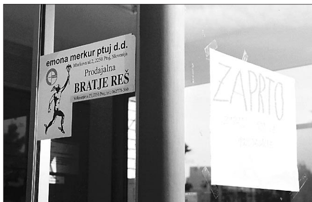
Samopostrežba Bratje Reš kmalu ponovno odprta.