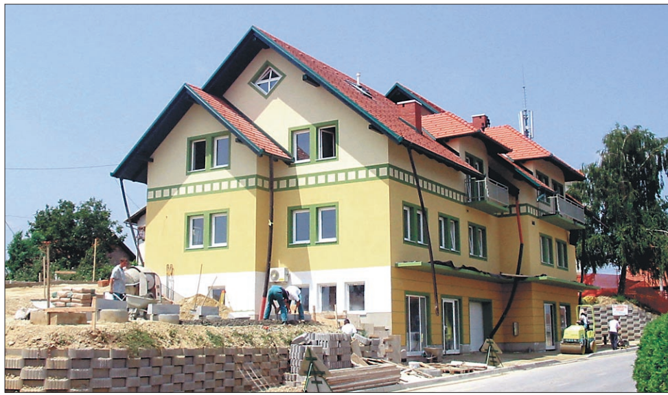
Nova večnamenska stavba, v kateri je prostor tudi za zdravstveno in zobozdravstveno ambulanto

"Predvsem naša večnamenska stavba, ki jo v teh dneh končujemo. Investitor je Gradbeništvo Pintarič. V njej je prostor za zdravstveno in zobozdravstveno ambulanto, za pošto, trgovino in poslovni prostor, v mansardi pa smo pridobili štiri stanovanja. Ambulanti obsegata 360 kvadratnih metrov in te prostore je občina odkupila za 45 milijonov tolarjev. Objekt