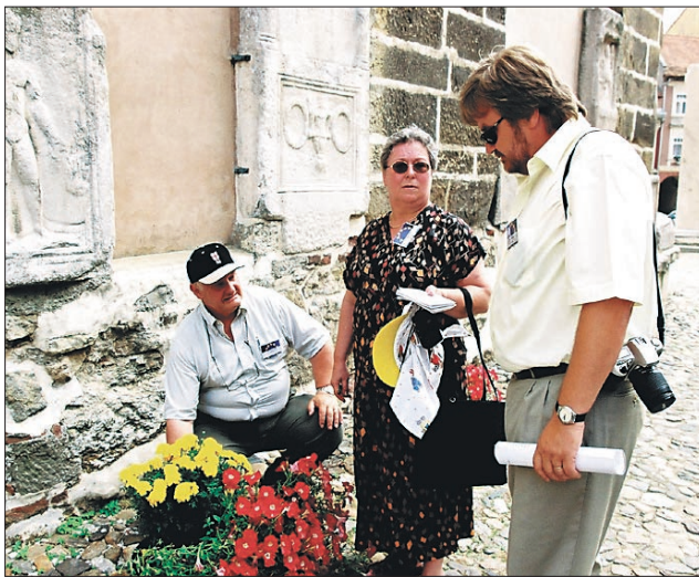
Korita iz odpadne gume so bila za člane komisije še posebej zanimiva