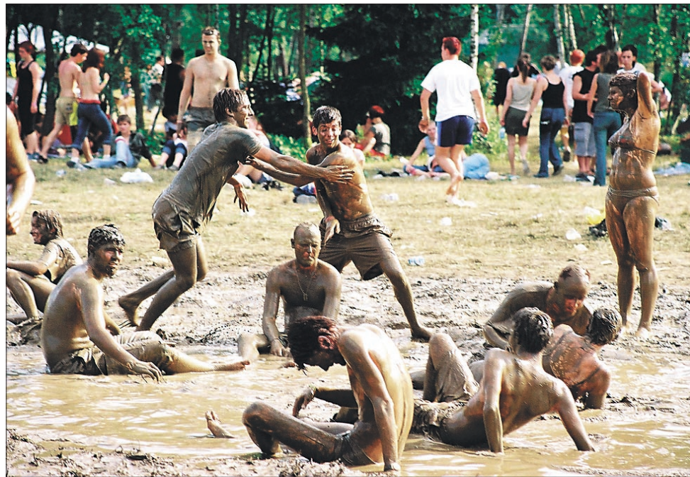
Nekateri v otroštvu pač niso izživelili ljubezni do blata ...

In kaj se je na Rock Otočcu še dogajalo? Zaščitna znamka dogajanja je brez dvoma blato. Že v reklamah so napovedovali, da bo Rock Otočec tudi v primeru lepega vremena. In ker je bil vikend res sončen, so za blato pač