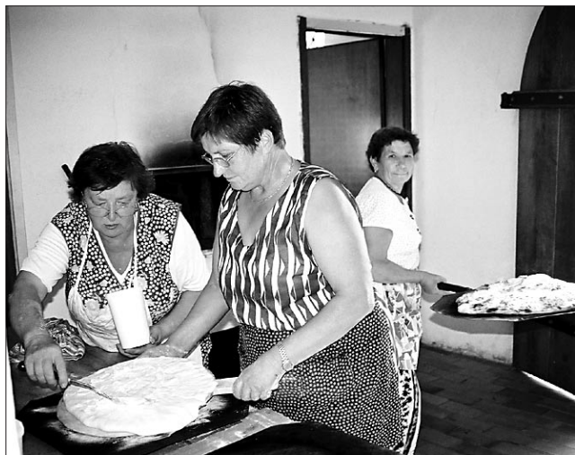
Najbolj iskana jed na Polenškaku je gotovo gibanica. Kljub vročini so žene dva dni preživele ob krušni peči.

Za posebno vzdušje so v soboto poskrbeli člani starodobnih vozil iz Ljutomera, ki so imeli