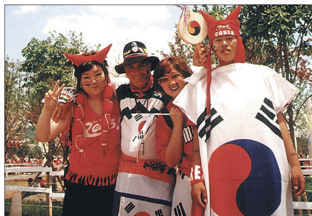
... Južne Koreje...