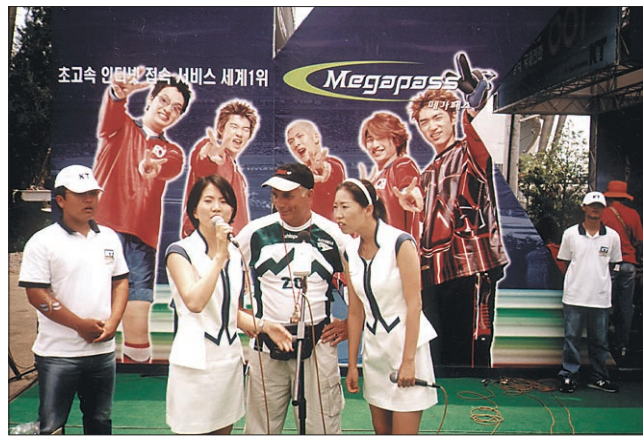
Medijski izkupiček: 21 intervjujev v dobrem mesecu