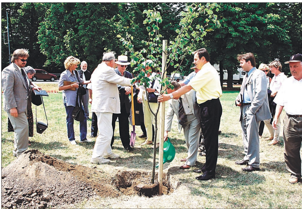
V spomin na prvo udeležbo Ptuja v okviru tekmovanja Entente Florale so na zelenici pri podvozu posadili lipo