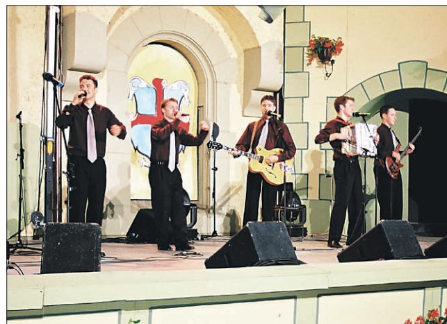
Ansambel Pogum iz Velenja je izvedel najboljšo melodijo po mnenju strokovne komisije.

Med novosti letošnjega festivala sodi nagrada Marjana Stareta, ki jo je Društvo pesnikov in pisateljev za dolgoletno in kvalitetno sodelovanje na področju besedilopisja dodelilo enemu najplodnejših avtorjev,