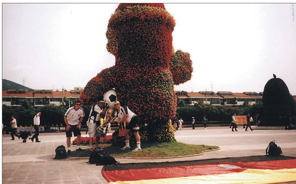
... in Nemčije.