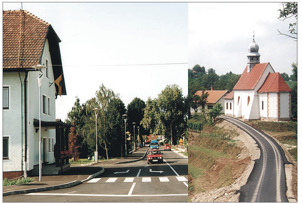
V občini so se trudili za enakomeren razvoj hribovitega in ravninskega dela.