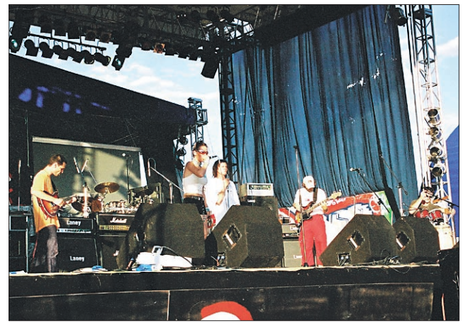
Ptujski Popperkegi so navdušili

Poskrbljeno pa je bilo tudi za kulturni del. Vsak dan je bila uprizorjena gledališka predstava, predstavil pa se je tudi Improklub iz Ljubljane, ki je že kar stalni spremljevalec Rock Otočca. Vsak dan so potekale ustvarjalne delavnice, v katerih so izdelovali nakit, risali na majice, grafito, face painting, body painting, seveda pa ni šlo niti brez literarne, slikarske in modne delavnice. Poskrbljeno je bilo tudi za skejtarje, rolarje in BMX-arje, saj je bila postavljena mini rampa, na kateri so predstavljali svoje vrline izkušeni športniki. Za popestritev so skrbeli tudi srbski trubači, padalski miting in bruhanje ognja, vsi spretni in malo manj spre-