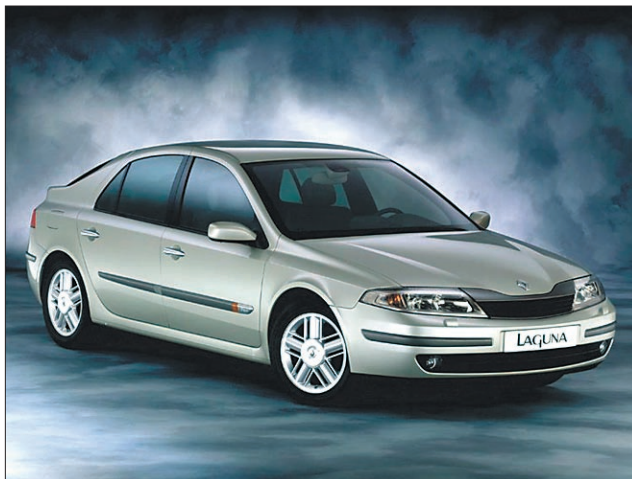
Laguna 2 — prvi dobitnik petih zvezdic

ne bodo izvažali v zahodno Evropo. Dolgoročni načrti so precej bolj optimistični, saj je predvidena proizvodnja tudi do 20 tisoč avtomobilov na leto. Le s tekočih trakov v Sarajevu