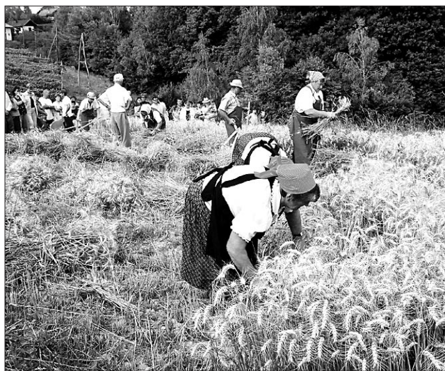
Žanjice so svoje delo opravile zelo hitro

Žetev je bila nekoč praznično delo, navzlic prazničnemu vzdušju pa ni bila nikoli lahko delo. V to nas je v nedeljo prepričalo osem žanjic, ki so jih tako kot nekoč na njivo pripeljali z lesenim vozom in konjsko vprego.