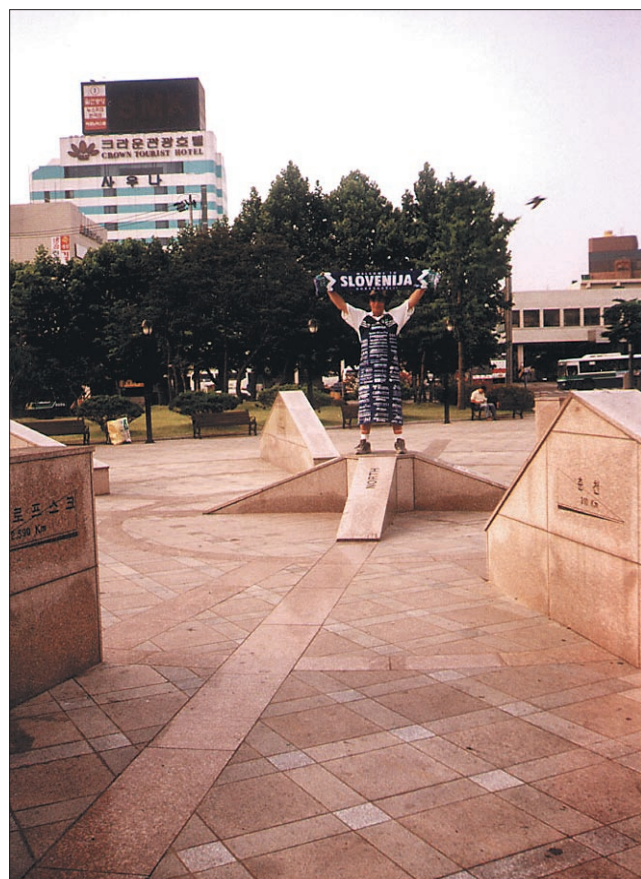
V središču (ničelna točka za izračun razdalij)