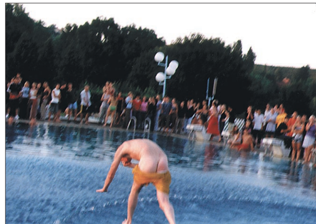
Nekaterim je bilo prevročje celo za kopalke

ljevalni program, ki se je dogajal tako na travi kot v bazenu. Tisti s športnih duhom so se pomerili v odbojki, vlečenju vrvi in skokih v vodo, bolj leni pa so lahko uživali v gledanju kajakašev in potapljačev ter predstavitvi Mito sport kluba. Za