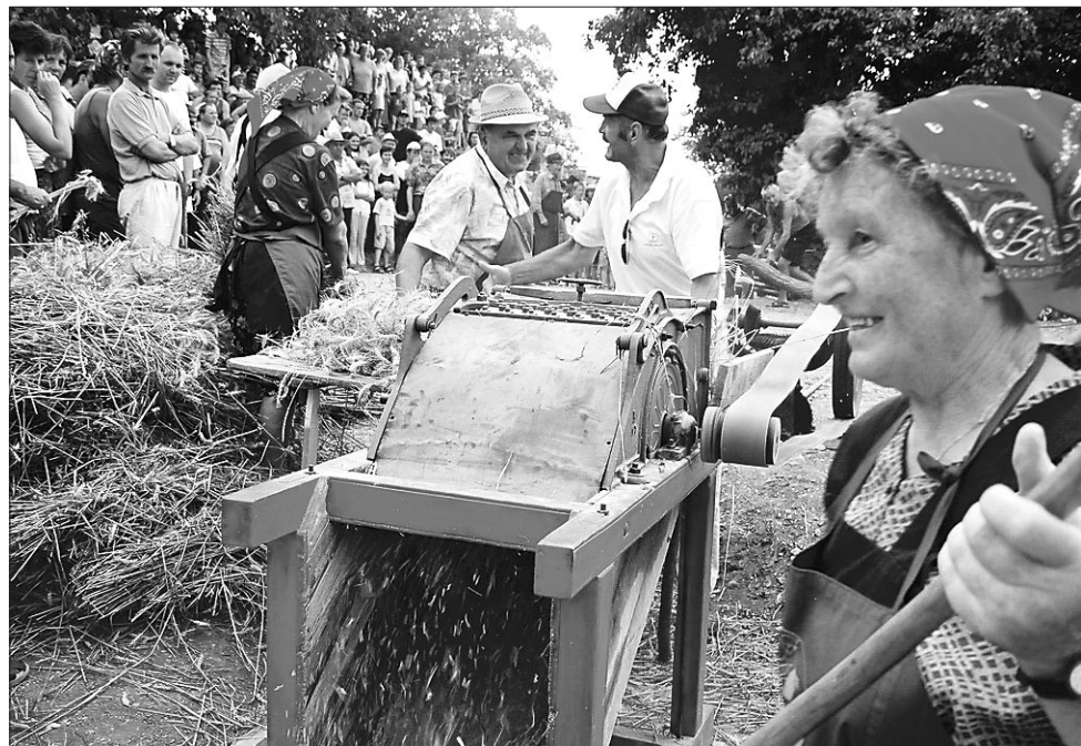
Številni obiskovalci so z zanimanjem opazovali mlattev z geplom, ki so ga poganjali konji