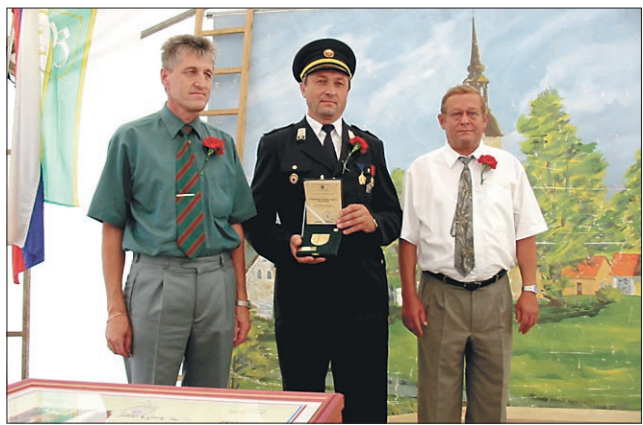
PGD Benedikt je ob 75-letnici delovanja prejelo zlati grb občine Benedikt