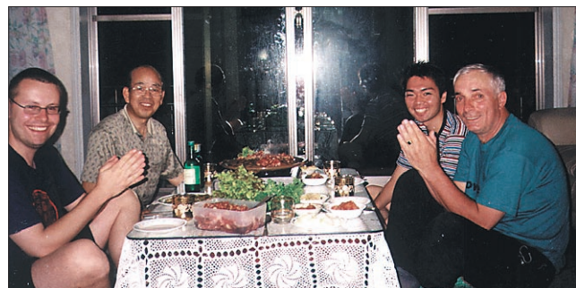
Ob polni mizi v družbi s prijaznimi korejskimi gostitelji