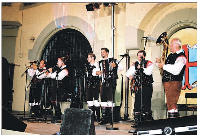
Med odmorom se je ptujskemu občinstvu predstavil ansambel Murski val iz Kanade

Četrta novost je v tem, da so organizatorji po dolgih letih spet uspeli pritegniti nacionalno televizijo, ki je prireditev v celoti posnela in bo na sporedu to soboto, 20. julija, ob 20. uri na drugem programu. Prireditvev je posnel tudi Radio Slovenija in jo prenašal že naslednji večer, neposredno pa sta 33. festival prenašala radia Maribor in Ptuj; slednji je poskrbel tudi za predstavitev zakulisnega dogajanja in za prve izjave najboljših. Peta novost je v sočasni izdaji CD plošče in kasete z 12 izbranimi skladbami, oboje pa so lahko obiskovalci kupili že ob vstopu na prireditveni prostor.