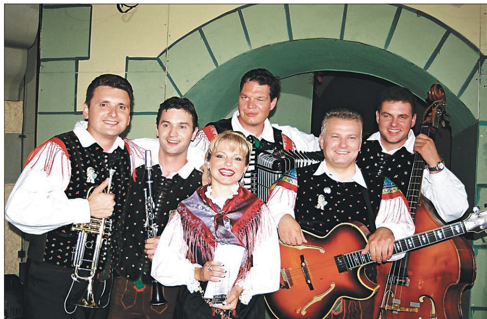
Najvišjo festivalsko nagrado, zlatega orfeja, je po odločitvi strokovne komisije prejel ansambel Vitezi celjski

ORMOŽ, PTUJ / ZA MATURANTI PRVA VELIKA ŽIVLJENJSKA PREIZKUŠNJA