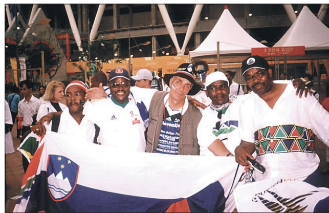
Z navijači Senegala...