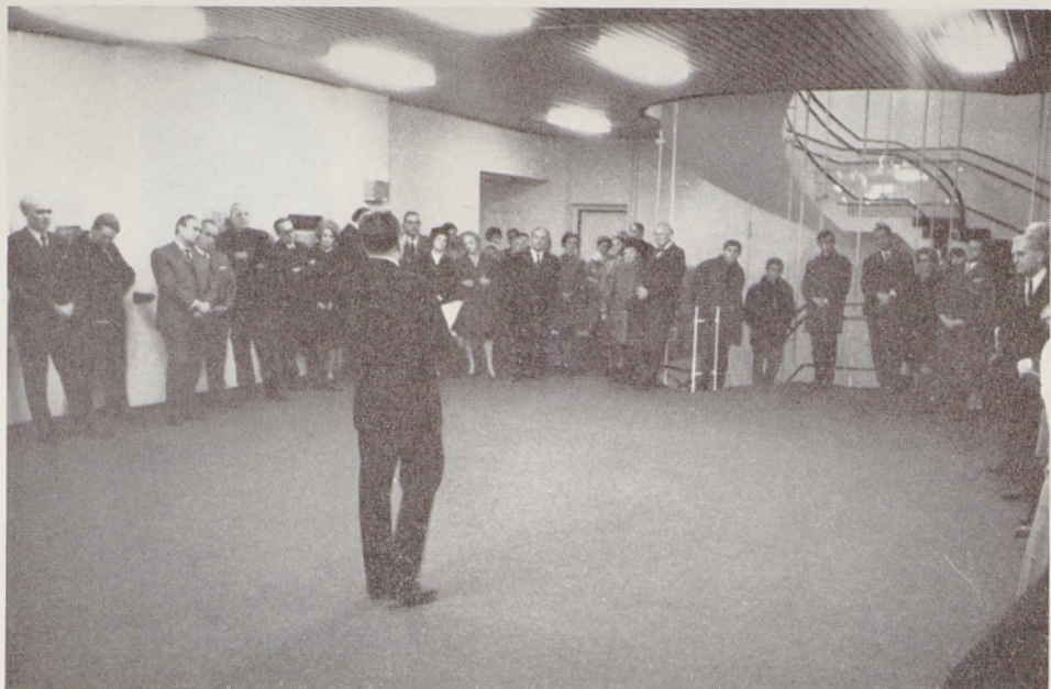
Dr. Bratko Kreft odpira razstavo Prve uprizoritve Cankarjevih dram v novem foyerju Mestnega gledališča ljubljanskega (decembra 1968)