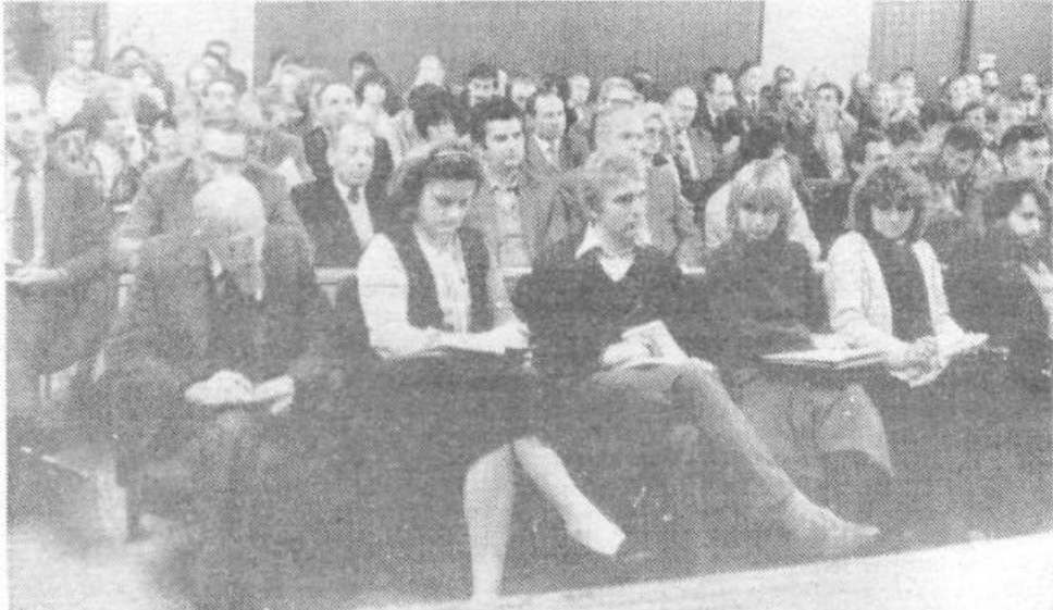
18. oktobra je OK ZKS sklicala posvet komunistov, ki delujejo v vodstvih družbenopolitičnih organizacij, skupščine občine, SIS in IS Sob. Posveta pa so se v velikem številu udeležili tudi individualni poslovodni organi in sekretarji OO ZK večjih OZD in sekretarji OO ZK iz krajevnih skupnosti. Na posvetu so se dogovorili o aktualnih nalogah in aktivnostih pri uresničevanju sklepov 3. sej CK ZKJ in CK ZKS.

Na zadnji seji občinske konference ZKS so sprejeli zajeten program dela OK ZKS in njenih organov za obdobje oktober 1982-marec 1983, sprejeli so osnutek Statutarnega sklepa o organiziranosti in delovanju organizacije ZKS v občini