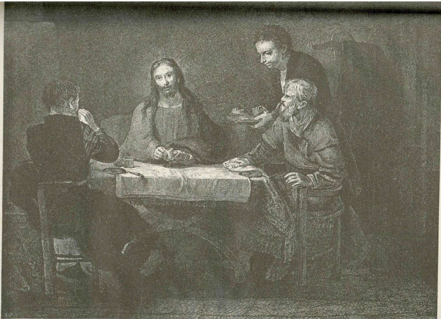
Učenci v Emavsu. (Slikal Rembrandt.)