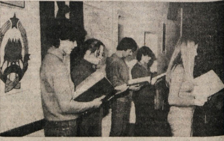
Skupina mladih iz Nove Gorice je nastopila na proslavi v Dijaškem domu

Lepo število žena se je odzvalo vabilu Zveze slovenskih kulturnih društev na sprejem ob jugoslovanskem državnem prazniku, 29. novembra, ki je bil v prostorih zveze v Ulici della Croce v petek zvečer.