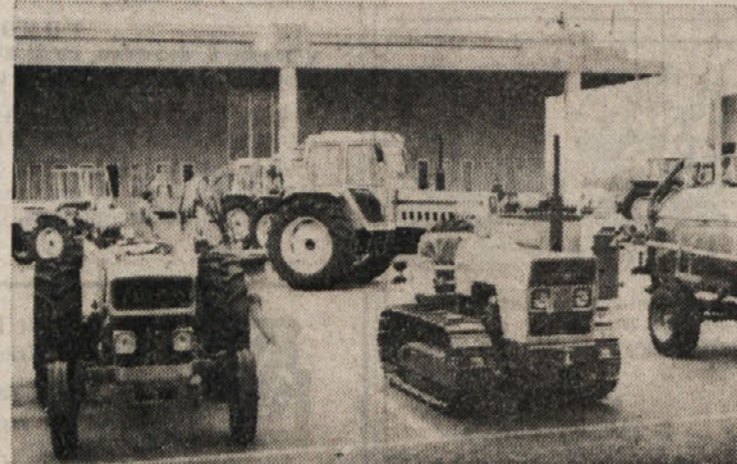
Kmetijski stroji na sejmju Espomego v Gorici

Svoje proizvode razstavlja 40 tovarn in podjetij - Napredek kmetijstva odvisen od napredka ostalih gospodarskih vej