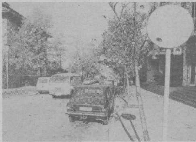
Enako velja za voznike osebnih avtomobilov pred gostilno Fortuna, le da tam mnogi parkirajo celo po pločnikih.