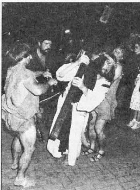
Kristus omaguje pod križem.