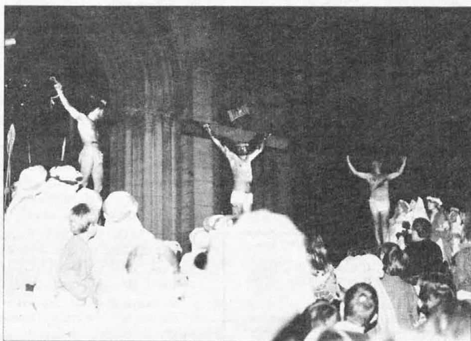
Kalvarija in križanje (pred stolnico).