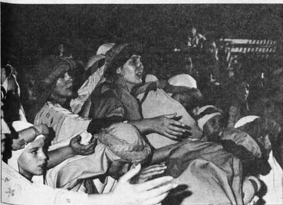
Judovsko ljudstvo žaluje za Kristusom.