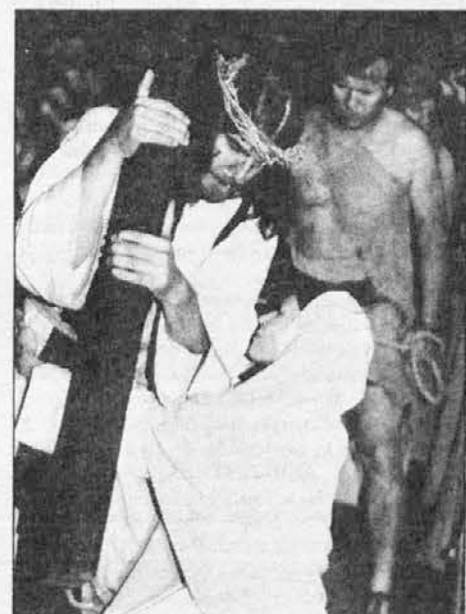
Kristus sreča svojo Mater.