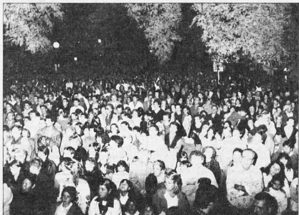
Velika množica argentinske publike sledi z zanimanjem križevemu potu.