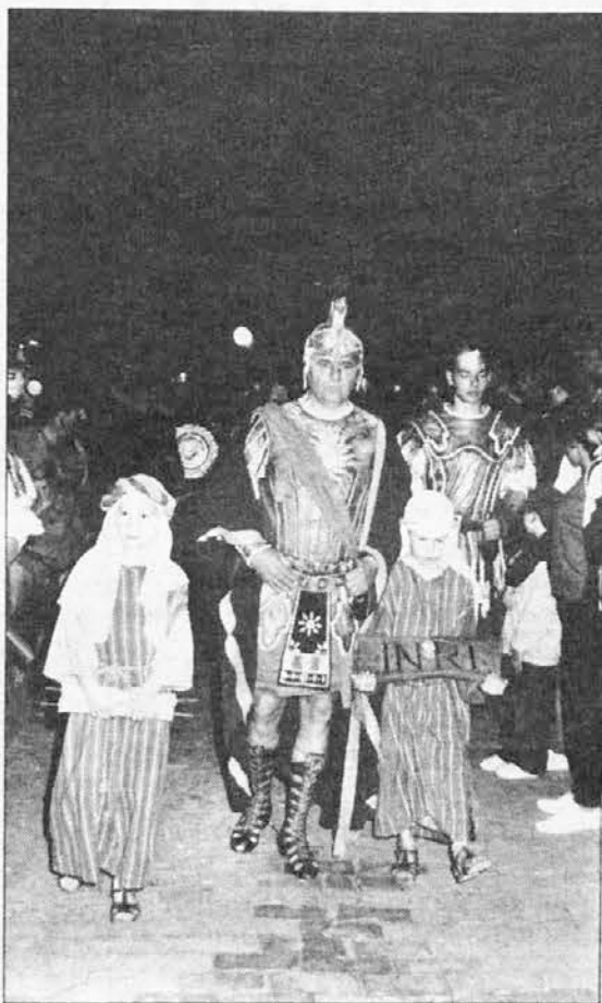
Rimski stotnik vodi križanje.