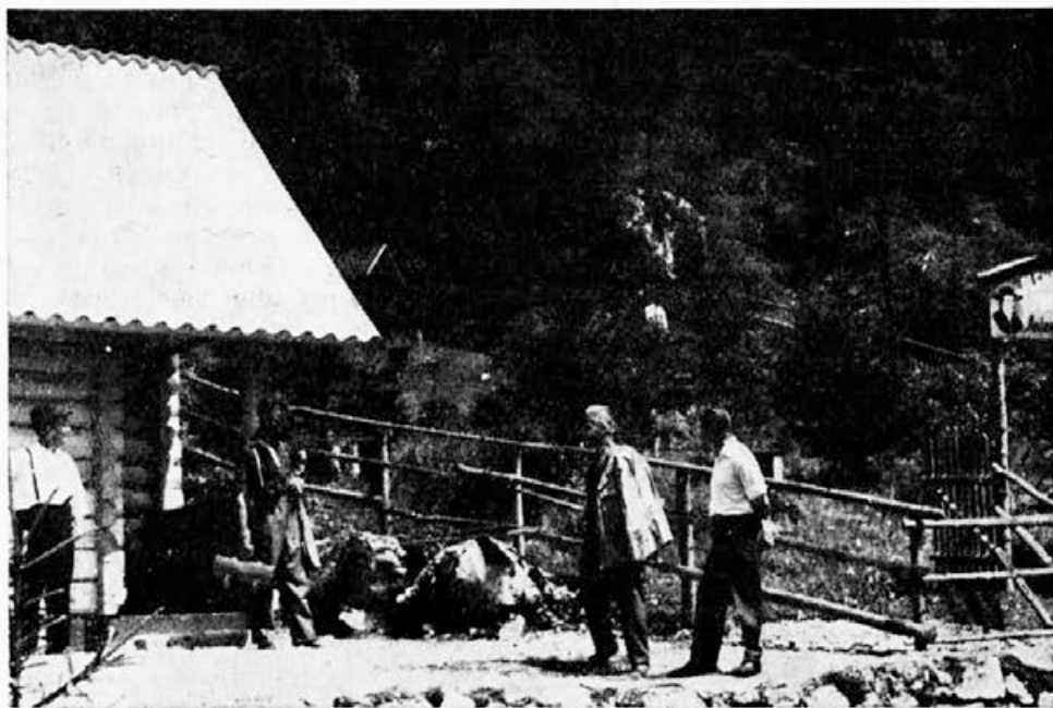
Koča na plemenilni postaji pod Zelenico tik pred dovršitvijo.

Nekatera društva so si ustvarila tudi že dobre odnose z občinami. S čebelar-skimi organizacijami v zamejstvu so naši stiki vedno bolj pogosti. Medsebojni odnosi se razvijajo povsem sproščeno na osnovi pristnega prijateljstva, resnične demokracije in strokovnega sodelovanja. Krog poznanstev z vidnimi čebelarskimi delavci se vedno bolj širi. K temu so mnogo pripomogli mednarodni čebelarski kongresi v Pragi, Bukarešti in v Washingtonu v ZDA. V preteklem letu so nam sporočile čebelarske organizacije iz Italije, Francije, Belgije in Finske željo po zamenjavi njihovih glasil s Slov. čebelarjem. Objektivne težave so pa v tem, da je naš jezik jezik maloštevilnega naroda in zato malo poznan. Zato nam je Dokumentacijska centrala Apimondije, ki ima svoj sedež v Dolu pri Libčicah na Čehoslovaškem, že nekajkrat pisala, naj imajo važnejši članki naših piscev na koncu še izvleček v enem izmed kongresnih jezikov (angleški, ruski, francoski in nemški). Že maja 1967 smo na uredniški seji sprejeli sklep, da bomo ustregli tej želji. To je za nas ne samo častna, temveč bolj ali manj tudi obvezna zadeva, ker smo po Zvezi čebelarskih organizacij Jugoslavije posredno tudi član Apimondije. Morda bi ta zadeva bolje uspevala, če bi v prihodnje avtorji člankov, v kolikor obvladajo kak kongresni jezik, sami poskusili napraviti tudi izvleček. Saj bodo sami najbolje zadeli jedro svojega članka. V kolikor tega ne bi mogli napraviti, bo preskrbel prevod uredniški odbor.