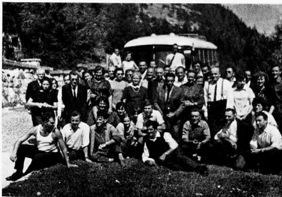
Clani ČD Ajdovščina so napravili izlet prek Vršiča v Radovljico. Tu so si ogledali čebelarški muzej, potem pa so obiskali še Breznico.