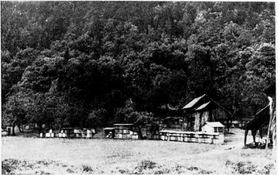
Skladavnice panjev na kostanjevi paši pri Jevnici

Obsoditi moramo pojav, ki je bil letos še osamljen, utegne pa se kdaj ponoviti v večjem obsegu. Nekaj čebelarjev je potem, ko so po prvih poročilih o donosu pripeljali svoje čebele v bližino opazovalne postaje, začelo nagovarjati obveščevalca, naj raje poroča o nižjih donosih, kot so v resnici, ker bo sicer kmalu vsa okolica prenatrpana s panji novодоšlih čebelarjev. Menimo, da je vsak komentar tukaj odveč in upamo, da drugo leto o tem pojavu ne bo več treba pisati.