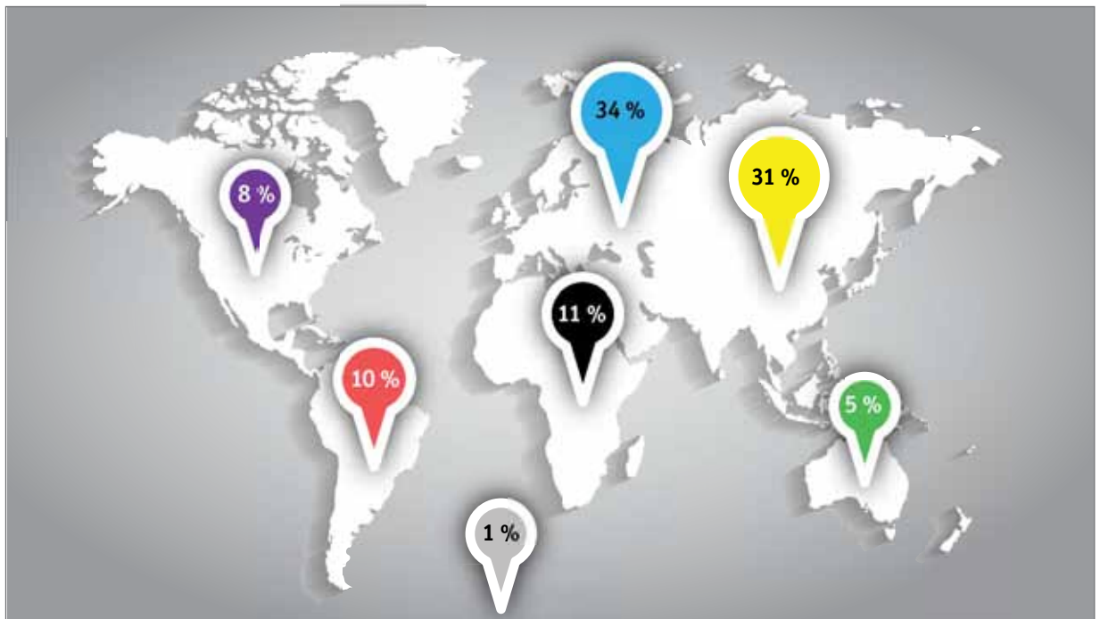
Slika 1: Sestava potopisnih predavanj po celinah.

obvestili (navadna in spletna pošta) posredovano članom Ljubljanskega geografskega društva, objavljeno je bilo tudi na Geolisti in teletekstu TV Slovenije ter na oglasnih deskah Oddelka za geografijo Filozofske fakultete Univerze v Ljubljani in Geografskega inštituta Antona Melika ZRC SAZU. Z željo po povečanju dometa obveščanja zainteresiranih poslušalcev in njihove udeležbe na predavanjih se je v zadnjem času dejavnost oglaševanja razširila tudi na druge medije, kot so revije in spletni portali s popotniško vsebino: Potnik.si, Horizont, Svet in ljudje, Popotniško združenje Slovenije, NaProstem.si in podobno. V zadnjem času je zelo pomemben vir obveščanja postal društveni spletni profil na portalu Facebook, na katero vabimo vse, ki jih zanimajo informacije o potopisnih predavanjih in ostalih dejavnostih društva.