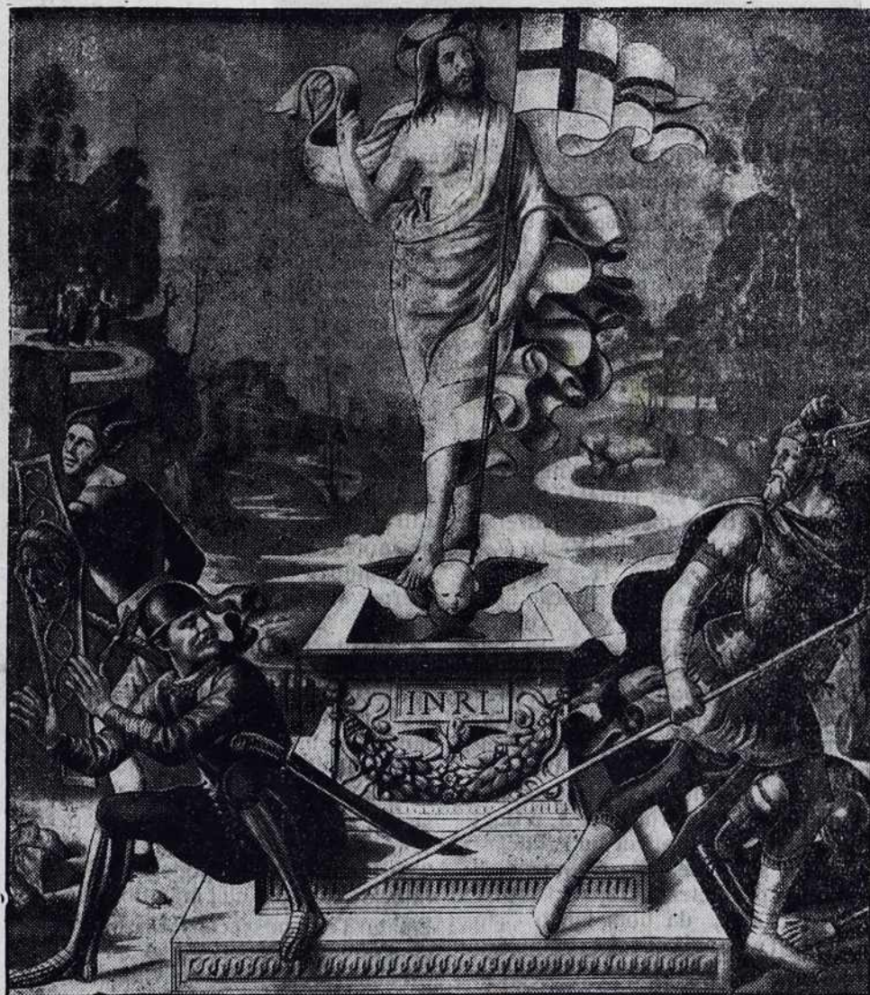
Moj Jezuš pa žive, več nikdar ne vmerje, o kakše, kakše veselje!

grob i zagledale mladenca, sedečega na desnici i ogrnjenoa z belim oblačilom, i so se prestrašile. On njim pa pravi: „Ne bojte se! Jezuš iščete, Nazarenskoga, križanoga; gori je stano, ga ne tü. Glejte kraj, kamo so ga položili. Nego idite, i povejte njegovim vučenikom i Petri, da ide pred vami v Galilejo; tam ga bodete vidili, kak vam je povedao“.