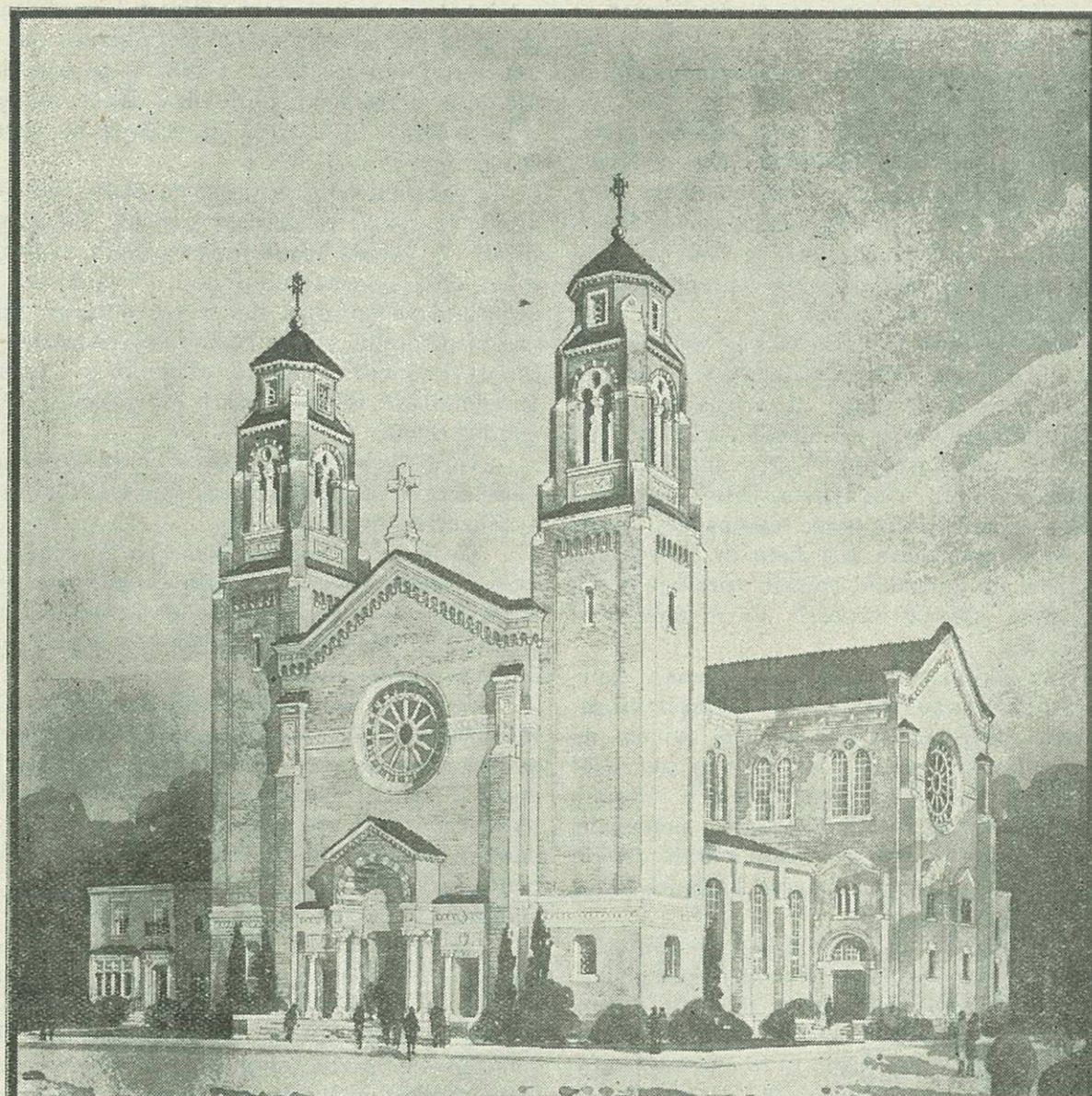
Cerkev sv. Vida v Cleveland, Ohio.

20. novembra bo minulo ravno leto, kar je bila blagoslovljena cerkev sv. Vida v Clevelandu, Ohio, ki je ena največjih in najlepših slovenskih cerkva v Ameriki, in je v velik ponos vsem slovenskim katoličanom v Clevelandu.