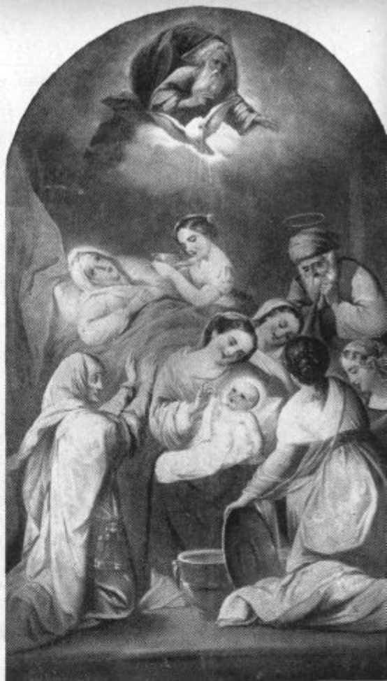
Stroj Mihael: Marijino rojstvo - Šmarje

Ali ni vse to danes prav tako resnično in potrebno, kakor je bilo pred letom dni? Zato s prvimi petki ne prenehajmo, ampak nadaljujmo, dokler trajajo