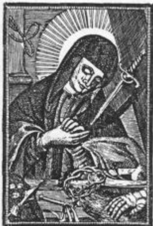
Žalostna Mati božja pri sv. Florijanu v Ljubljani

Kaj namerava božja Modrost in Previdnost, ko pošlje svojo ŝibo,