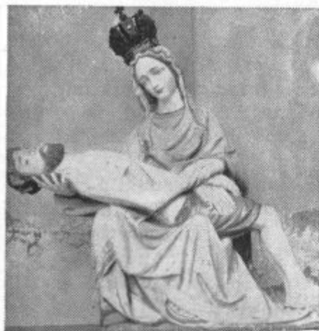
Žalostna Mati božja Sv. Primož nad Kamnikom

ljive moči; verniki pa so njegovi udje, ki iz njega srkajo nadnaravno življenje kakor mladike iz trte.