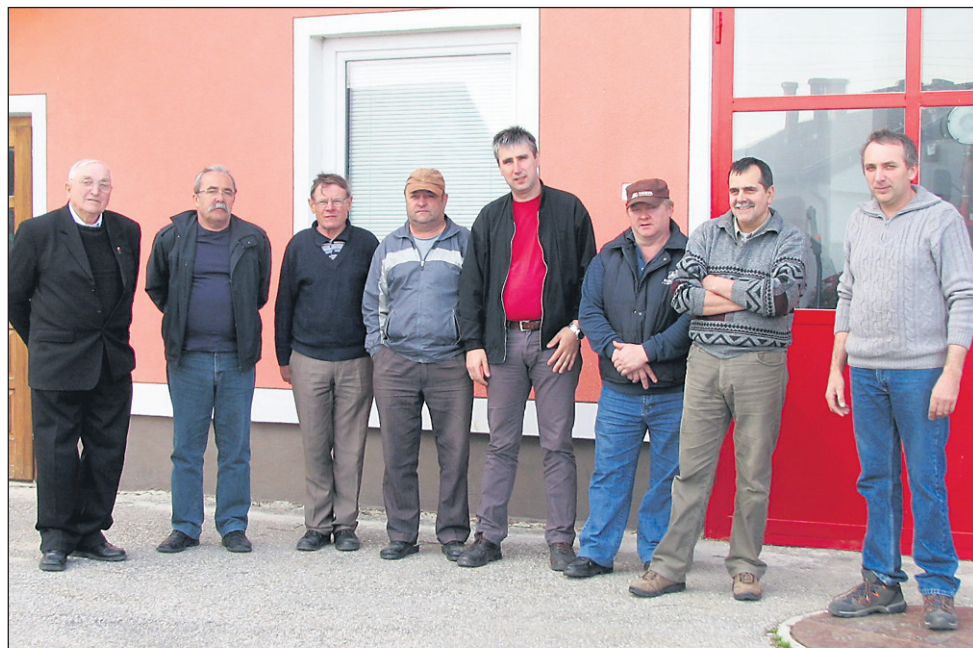
Člani PGD Desenci so enotnega mnenja, da ključev dvorane ne bodo predali in jo v skladu z neizpolnjeno pogodbo želijo nazaj v last.

Ključ dvorane imajo v rokah člani PGD Desenci in ga ne nameravajo predati občini, ker pravzaprav sploh ne verjame-