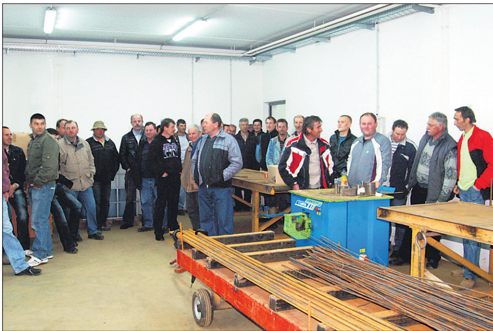
Obupani delavci podjetja Gradis Gradnje Ptuj so se v času stavke zbrali v delavnici in čakali na odločitev lastnikov, vodstva podjetja ter predvsem sodišča.