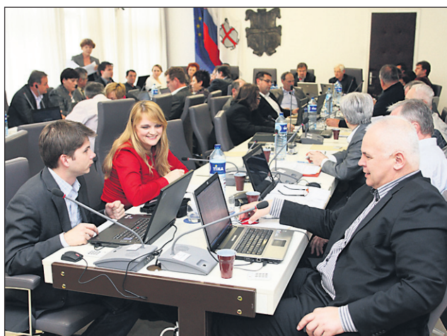
Ptujski mestni svetniki so v ponedeljek razpravljali o 18 točkah dnevnega reda.

Eden od ciljev tega programa je tudi ureditev infrastrukture za izvedbo zunanjih kulturnih in drugih prireditev, o tem potekajo razprave že od leta 1967, ustanovitev Mestne galeriji v sklopu prenove dominikanskega samostana, ureditev prenosa lastništva griča Panorama, ki naj bi postal last MO Ptuj, ki ga namerava hortikulturno urediti, prav tako pa tudi arheološki park. Osrednji investicijski projekt EPK 2012 ostaja prenova dominikanskega samostana v kulturno-kongresno dvorano, na programski ravni pa je prvi in osrednji projekt Kurentovanje, Ptujčani si želijo, da bi ptujski karneval tudi s pomočjo EPK postal enako prepoznaven dogodek, kot so pustne prireditve v Benetkah, karneval v Rio de Janeiru, Nici in še kje. Lokalni kulturni program je dobil podporo 18 svetnikov, devet pa jih ni glasovalo. V razpravi, v kateri je sodelovalo več svetnikov, so govorili tudi o potrebi ustanovitve zavoda za promocijo kulture, kot ga poznajo tudi v drugih mestih. V besedilo programa so vključili amandmaja, da bodo v okviru oddelka podjetja Javnih služb poskrbeli za organizacijo in tehnično podporo kulturnim in javnim prireditvam, ki bo to