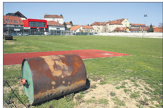
Na Mestnem stadionu bodo danes položili temeljni kamen za novo večnamensko dvorano.