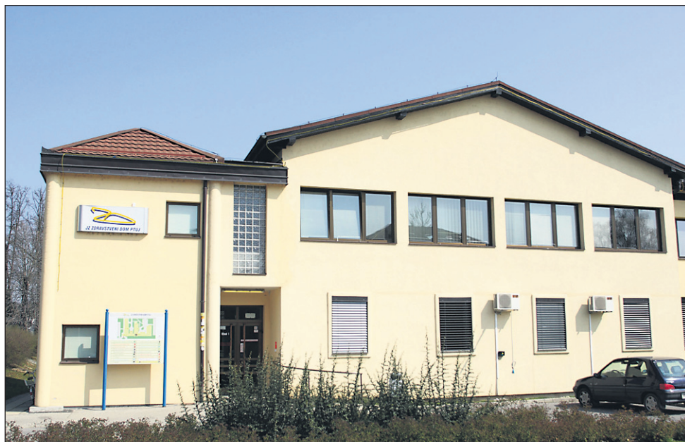
Zdravstveni dom Ptuj je lani posloval pozitivno.