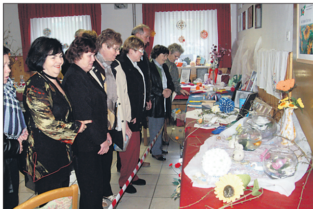
Razstava ročnih del društva Invalid Kidričevo je bila posebej dobro obiskana v nedeljo, ko je bila v Lovrencu slovesnost ob materinskem dnevu.