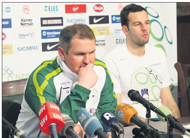
Selektor Matjaž Kek je proti Severnim Ircem opravil tri menjave v začetni enajsterici glede na tekmo z Italijo.

Naši reprezentanti so v torek v Belfastu znova odigrali pod svojimi realnimi zmožnostmi. Matjaž Kek je glede na tekmo z Italijo opravil tri menjave v začetni enajsterici, poleg ka-