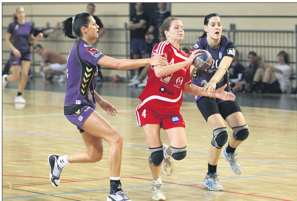
Ptujčanke (na fotografiji Korotajeva) so v ponedeljek z ekipo Krima odigrale prvo tekmo končnice.

Ptujčanke so se pogumno podale v boj s favoritinjami, pristop je bil pravi in v 15. minuti je na semaforju pisalo 9:9. Krimovke se kar nekaj časa niso mogle odlepiti od trdoživih gostij, še v 20. minuti je bilo le 16:14. Šele v sami končnici prvega dela so štajerkice nekoliko popustile (razlika sta »pridelali« predvsem vratarka Grubišičeva ter Mavsarjeva) in domačinke so na odmor odšle