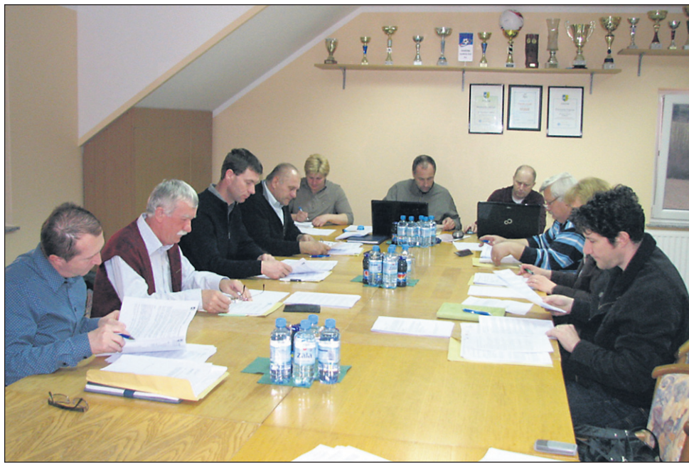
Podlehnški občinski svet v polni sestavi je brez razprave in pripomb soglasno potrdil predlog letošnjega proračuna občine.

vrtca že prijavi na razpis, v teh dneh smo vlogo morali še nekoliko dopolniti in zdaj čakamo na sklep o sofinanciranju, ki bi moral priti naslednji mesec, aprila. Drugi večji projekt bo izgradnja kanalizacije v središču občine, za kar že imamo pozitiven sklep o sofinanciranju iz razpisa za Južno mejo in kar bo tudi zahtevalo skoraj pol milijona evrov. Jasno pa je, da kanalizacija v središču občine moramo urediti, sicer ne moremo načrtovati niti ureditve urbane središča občine. Nadalje je med vidnejšimi stroški za letošnje nakup traktorja z dodatno opremo, saj veste, da bomo ustanovili svoj režijski obrat, kar nam bo bistveno pocenilo vzdrževalna dela na naših cestah. Tudi garažo za traktor in orodja bomo zgradili, projekt je že v pripravi. Ker smo prejeli zavrnjeno