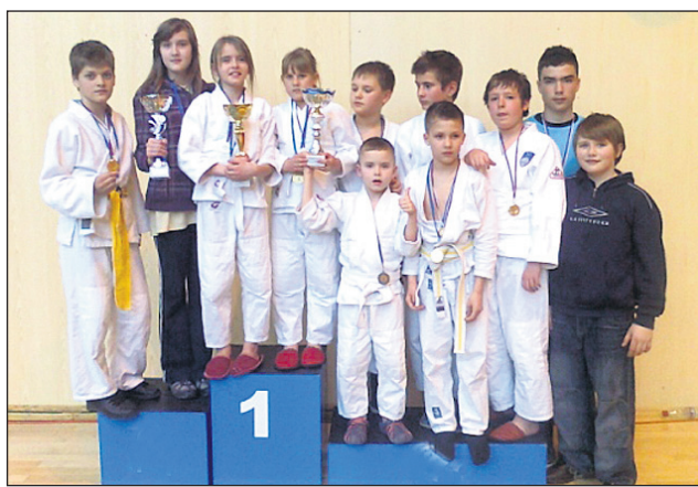
Zmagovalna ekipa OŠ Juršinci

juda v OŠ Ljudski vrt, so »potarjali«, da kljub novi telovadnici v OŠ Ljudski vrt tam ne morejo dobiti niti enega termina za vadbo. Zanimivo je, da tam ni osnovnih pogojev za vadbo juda, saj v šoli nimajo ustreznih blazin! Le-te pa imajo v šolskih telovadnicah v sosednjih občinah, kjer judo ni tako doma kot na Ptuj, kjer je po mednarodnih rezultatih najuspešnejši klub, ki je ponosel ime mesta po Evropi in svetu. Na predstavitev, ki jih organizira JK Drava na osnovnih šolah, so mladi pokazali velik interes za vadbo juda, vendar je osnovna opremljenost športne dvorane