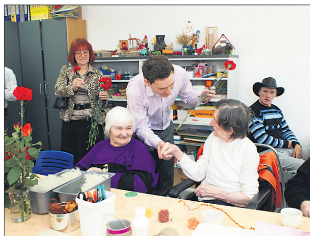
Vedno je lepo, če se kdo nepričakovano spomni na nas.