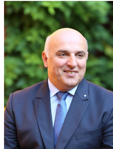
Miran Senčar, župan Mestne občine Ptuj