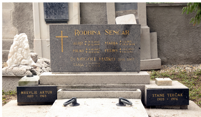
Nagrobnik rodbine Senčar na nekdanjem ptujskem mestnem pokopališču