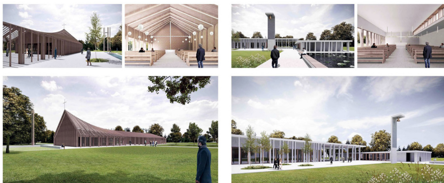
Poslovilni objekt, Varianta 1 / Varianta 2