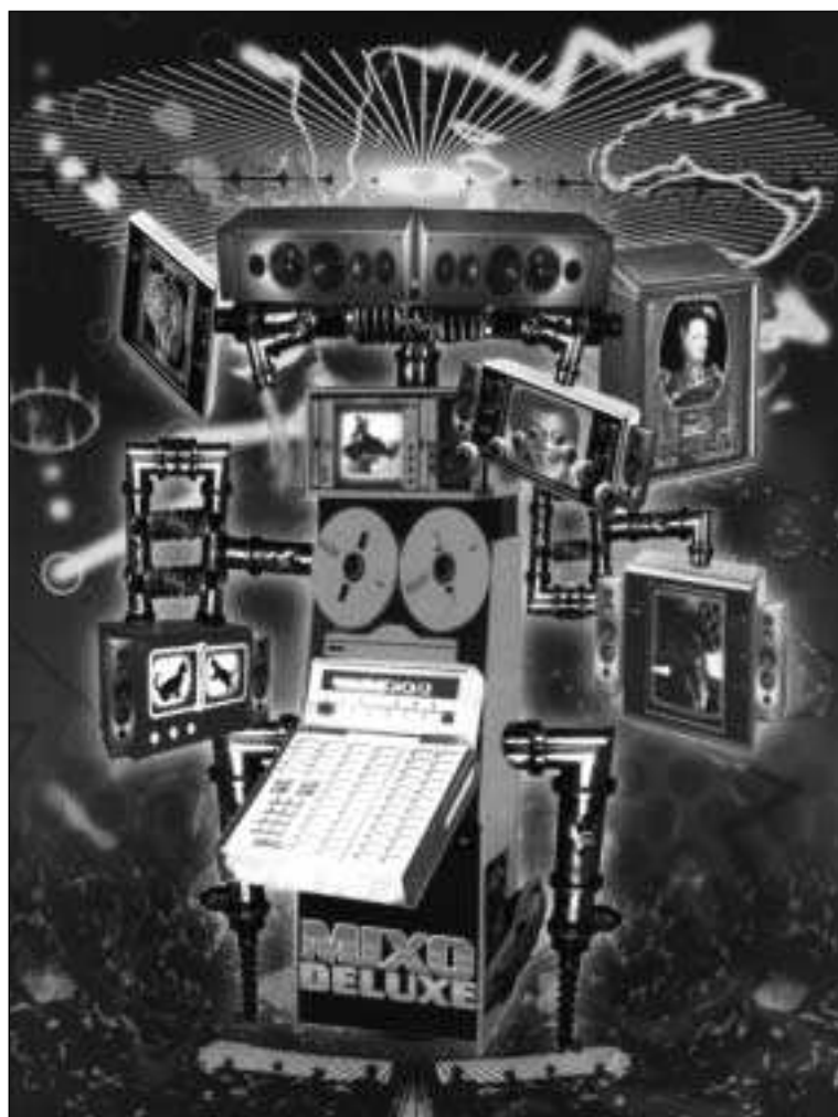
Ilustracija: Didier Cremiux

paj z raznimi stvori podajo na negotovo potovanje po čudaškem labirintu The Residents. Uporaba CD-ROM-a je sicer kar zapletena, zamudna in draga, vendar se po mnenju njegovih zagovornikov vztrajnost izplača. V zraku je namreč velik preobrat: namesto enostavnega pasivnega konzumiranja, kakršnega so spodbujali dosedanji nosilci zvoka (analogne plošče, CD, kasete), radio in televizija, naj bi novi mediji omogočali aktivno in kreativno poseganje poslušalstva v procese nastajanja glasbe. Navdušenje nad bodočo konkurenco so pokazali celo nekateri tradicionalno skeptični tiskani