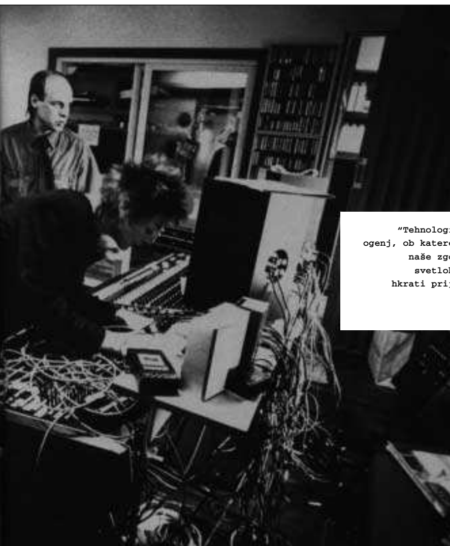
Laurie Anderson in Brian Eno v snemalnem studiu.

Korenine te glasbe segajo sicer daleč nazaj do prvih eksperimentalnih elektronskih iskanj, kljub temu pa je prava cyberpunk glasba – tako kot cyberpunk literatura – vendarle stvar zadnjega desetletja. Ni naključje, da se je pojavila v določenem trenutku, ko so nakopičena visokotehnološka odkritja začela groziti, da bodo dokončno ušla iz rok in popolnoma zadušila glasbeno kreativnost. Njeni najboljši ustvarjalci in ustvarjalke niso ponovili napak romantizirane, protiznanstvene in protitehnične protikulture šestdesetih. Čeprav so se na neki način vrnili h koreninam in stari hipijevski ljubezenski etiki, ki se zdaj uresničuje v ritualnem peklu rave partijev, se niso vrnili h kitari. Vzeli so na znanje znanstveni in tehnični napredek ter v tem iskali svojo