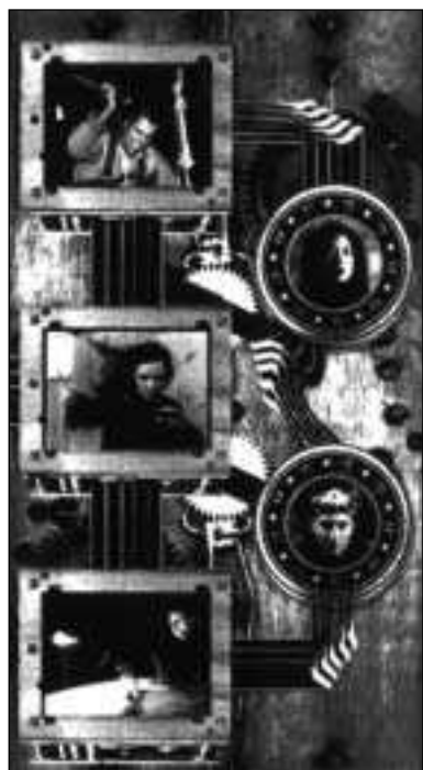
Ilustracija: John Borruso

V zvezi s ploščami, ki jim zagovorniki novih interaktivnih tehnologij tako radi očitajo pasivnost, je potrebno omeniti