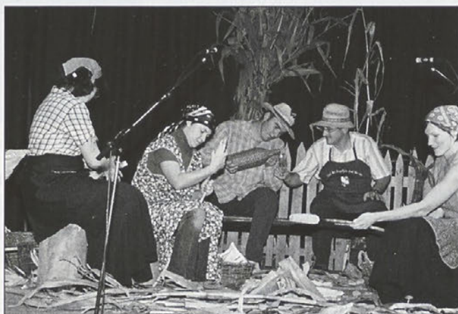
Pekli so si koruzo in razpravljali o tem in onem