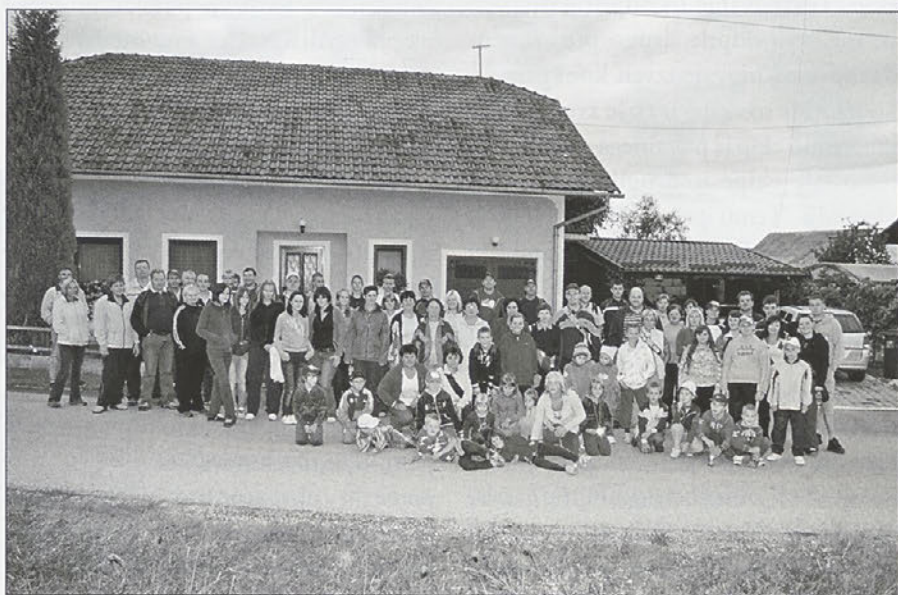
Pohodnikov je bilo okrog 90.