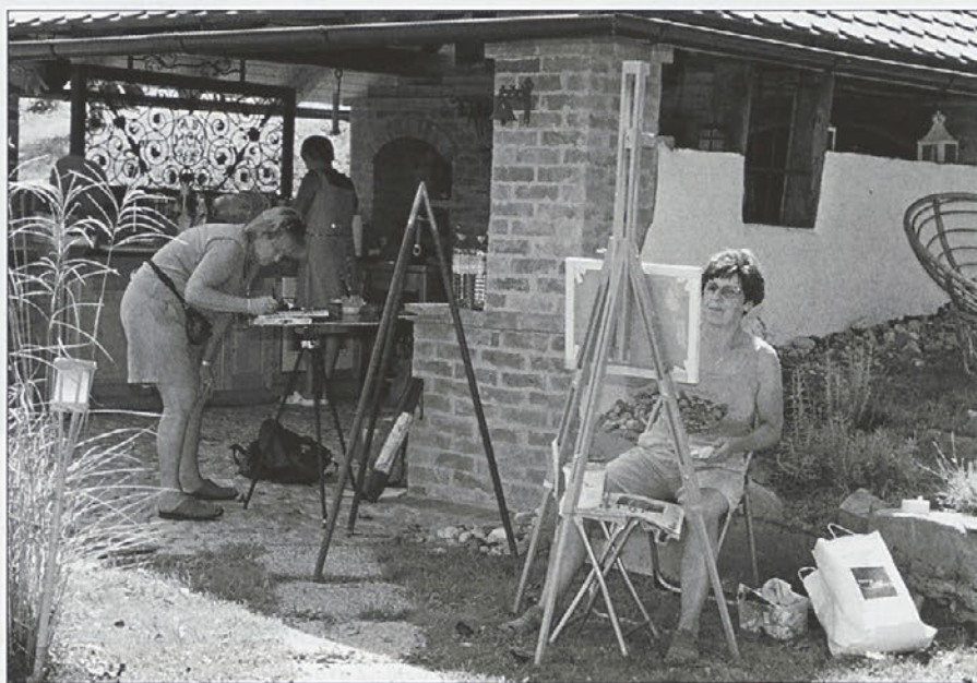
Ustvarjali smo v prijetnem vzdušju in deloma tudi v krasnem vremenu.