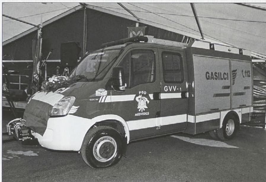
Novo gasilsko vozilo GVV-1