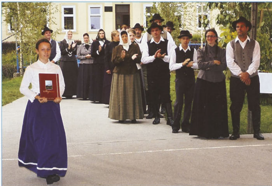
Množica ljudi je prvič uzrla stoperško knjigo.

S pomočjo donatorjev, od tega je velik delež sredstev prispevala Občina Majšperk, smo zbornik lahko poklonili vsakemu gospodinjstvu v Krajevni skupnosti Stoperce.