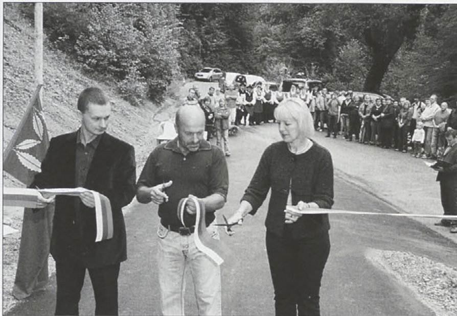
Cesta, ki se vzpenja na vrh hriba, je dolga 750 m in je od nas zahtevala veliko truda.

6.9.2009 smo ob 11. uri priredili manjšo slovesnost ob dokončanju modernizacije ceste Poluce – Parkelj, ki je v začetku meseca septembra dobila novo asfaltno preobleko. Cesta, ki se vzpenja na vrh hriba, je dolga 750 m in je od nas zahtevala kar veliko truda, medsebojnega sodelovanja in finančnih sredstev. Vendar nam je kljub temu uspelo. Zato smo se zelo razveselili dne, ko smo se lahko prvič sprehodili po novi asfaltirani cesti. Ob tej priložnosti nas je obiskala Folklorna skupina »Vinko Korže – veterani« iz Cirkovc. Ta skupina je ena najstarejših etnografskih skupin v Sloveniji. Skupina nam je zaplesala in odpela izvirne štajerske plese kot so poskakača, štajeriš, bušolenka in še mnoge druge. Kljub temu, da so rekli, da