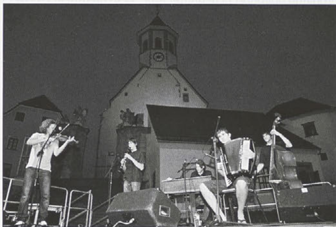
Mlada Beltinska banda

Bele krajine, pa tudi skladbe različnih zvrsti nekaterih bolj ali manj znanih glasbenih skupin. Lansko leto so izdali zgoščenko Špilaj! , na kateri so zbrane priredbe ljudskih pesmi Slovenije, Madžarske in Rusije. Bilo je tako lušno, da so sicer maloštevilne obiskovalce na trenutke zasrbele pete... In v soboto so zaplesale nastopajoče folklorne skupine na IV. Rožmarin Festu . Žal nam je spet zagodlo vreme in smo prireditve preselili v športno dvorano OŠ Majšperk. Letos so se nam predstavile folklorne skupine FD Rožmarin Dolena , FD Predgrad z mladinsko in veteransko skupino, KUD