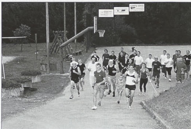
Tekači so pretekli od Ptuijske Gore do Majšperka.