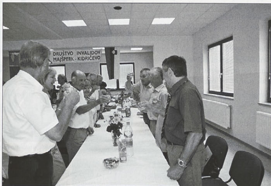
Zdravica članov društva in gostov