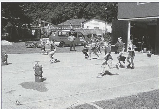
V gasilskih vrstah začnemo s tekmovanjem že v kategoriji pionirjev.