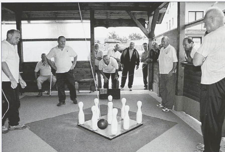
Turnirji so organizirani v smislu druženja in sodelovanja med društvi.

Ob tej priložnosti bi se zahvalil vsem članom DU Ptujška Gora kateri so s svojim delom in prispevki pomagali k uspešni izvedbi turnirja, pizeriji Gurman za prispevane nagrade ekipam in dobro postrežbo, zahvalil bi se tudi PGD Ptuj-