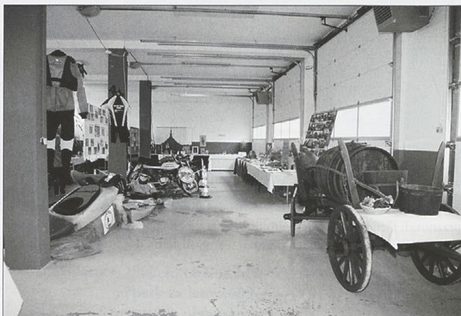
Razstavljeni eksponati na društveni razstavi v gasilskem domu PGD Majšperk.