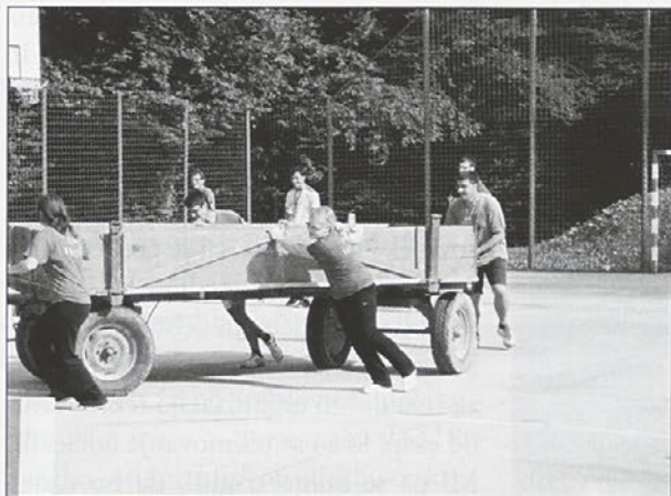
Kmečke igre so bile sestavljene iz 5. iger, ki so bile povezane z različnimi kmečkimi opravili.