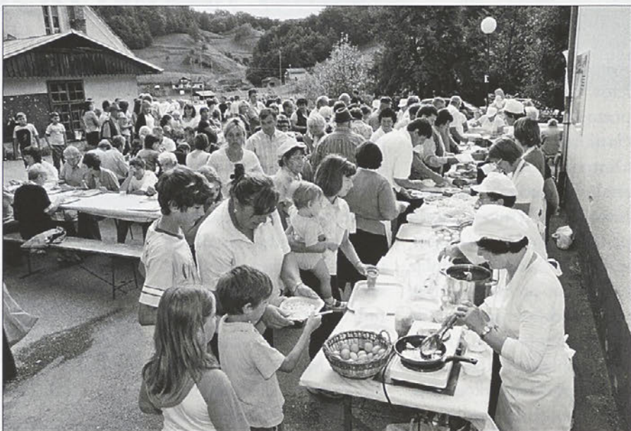
Tudi tokrat se je bilo prijetno družiti, malo poklepetati in pozajtrkovati.