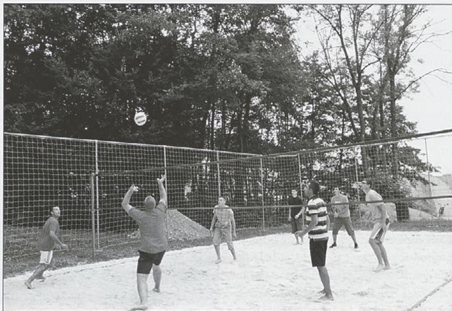
Na turnir v odbojki se je prijavilo 17 ekip.

V soboto, 22. 8. 2009, je na sestrškem igrišču potekal turnir v odbojki na mivki. Nanj se je prijavilo 17 ekip, od tega 12 moških in 5 ženskih ekip. Vreme nam, žal, ni bilo usojeno, zato so se odigrale le 4 tekme. Čeprav je bil turnir prekinjen, so se vsi prijavljeni igralci okrepčali z golažem in domačim kruhom. Ob tem naj povemo, da se je letos zgodilo prvič, da je bil turnir zaradi slabega vremena prekinjen.