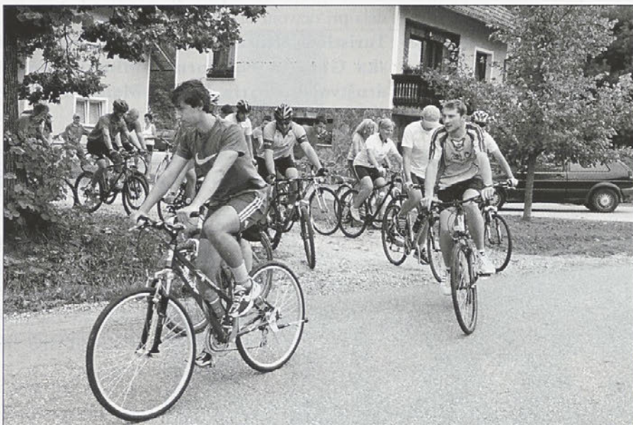
Gorski maraton je organiziralo Turistično društvo Naraplje.