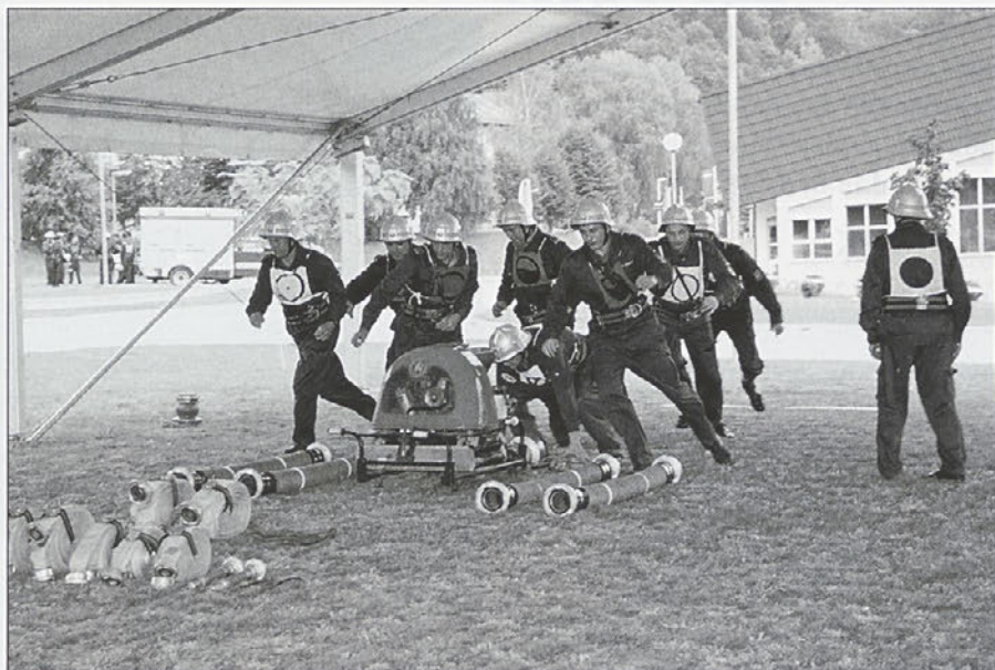
Za najboljše so bile pripravljene praktične nagrade.

Pri organizaciji tekmovanja smo aktivno sodelovali vsi člani društva. Moški so v soboto dopoldan postavili šotor, saj je bilo napovedano slabo vreme. K sreči ni bilo dežja, šotor pa se je izkazal za zelo koristno stvar, saj so vse ekipe izvajale vajo v senci. Tekmovanja se je udeležilo zelo veliko ekip. To smo tudi pričakovali, saj smo članice 112 ponesle glas o Majšperku po celi Sloveniji z udeležbo na pokalnih tekmovanjih. Sodelovalo je 16 moških in 7 ženskih ekip. Tekmovanje so odprli naši člani B, me smo odprle drugo progo, vendar smo tekmovali izven konkurence. Sodelovale so ekipe iz naše zveze, nekaj vrhunskih ekip iz pokalnega tekmovanja ter ostale ekipe iz drugih društev po Sloveniji. Temu primerni so bili tudi rezultati. Štafetni tek smo izvajali na igrišču OŠ Majšperk, za kar se jim zelo zahvaljujemo. Prvo mesto med članicami so osvojile PGD Hajdoše, druge so bile PGD Steklarna Rogaška, tretje mesto so zasedle članice PGD Gerečja vas. Med člani so prvo mesto osvojili PGD Tinje, drugo PGD Žetale, tretje PGD Kebelej. Najboljše tri ekipe med članicami in člani so prejele pokale v trajno last, prva ekipa še prehodni pokal, ostale ekipe so prejele diplomu