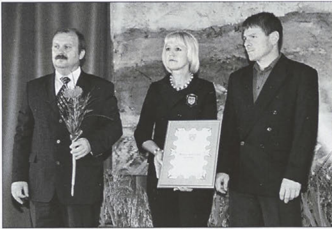
Društvo vinogradnikov in sadjarjev Majšperk