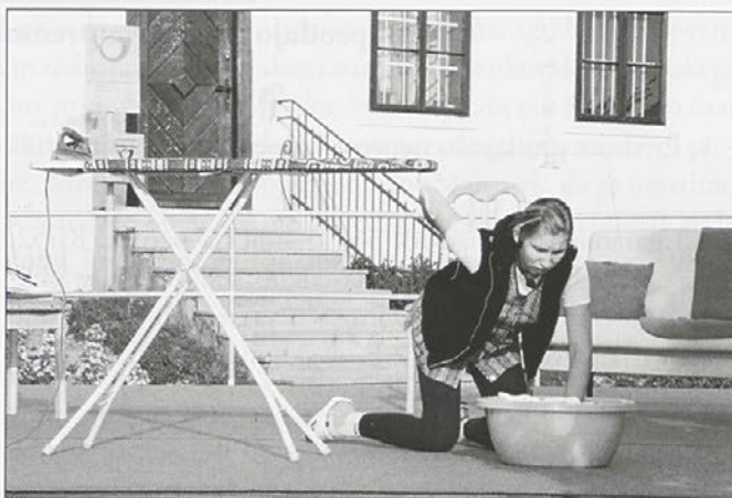
Iz predstave Čistilka Marija