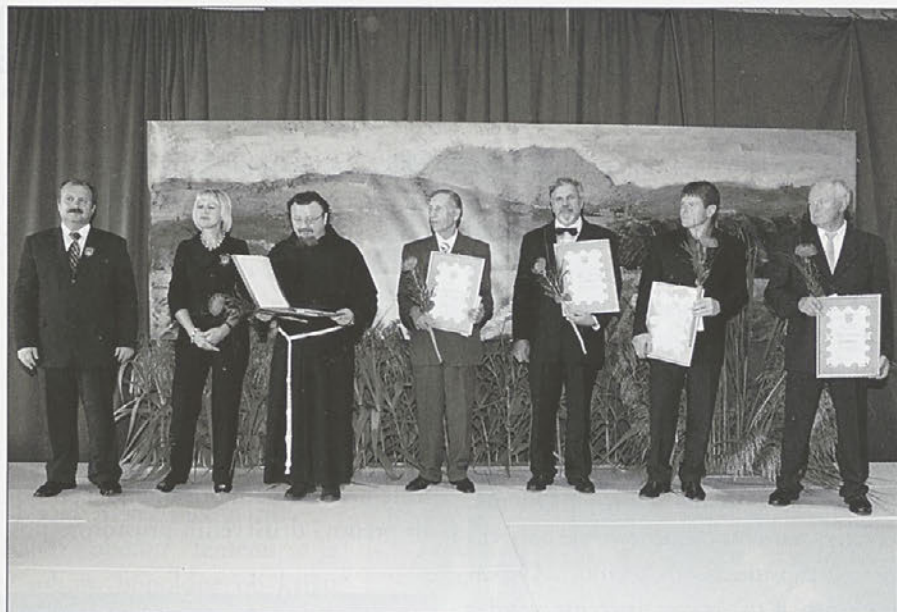
Dobitniki priznanj in plakete

Sicer pa je bila rdeča nit letošnje osrednje prireditve Marijina cerkev na Ptujski Gori, gotska lepota, na katero smo vsi ponosni. Čez nekaj mesecev bomo praznovali njeno 600-letnico zato smo se spomnili legende o njenem nastanku,