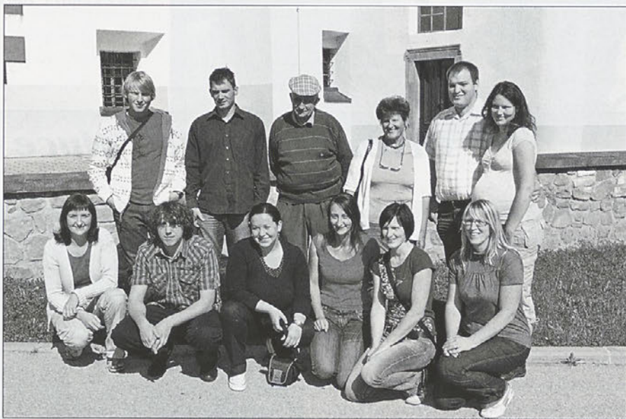
V nedeljo, 6. septembra, smo se ljubitelji fotografiranja zbrali pred učilnico župnijskega doma.

Medtem ko so nam kuharji pripravljali nekaj za pod zob, pa je g. Kerbler začel z izborom fotografij, ki so do 3. septembra prispele na naš naslov. Bilo jih je kar 92, tako da g. Kerbler ni imel lahkega dela. Izbral je 40 fotografij, ki jih je označil za dobre in smo jih izobesili na razstavi ob občinskem prazniku, od tega 4 najboljše. 1. nagrado (DVD-player in izdelava fotografije 60x40 - FOTO BRBRE)