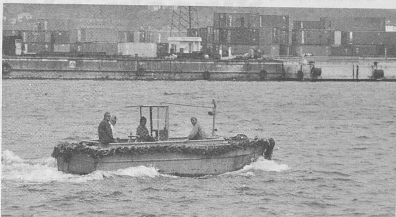
Fantje, mirno morje