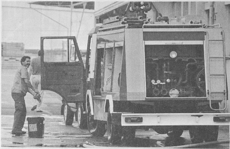
Gasilec Gabrijel Štravs: "Skrb za gasilsko vozilo je naše redno delo"