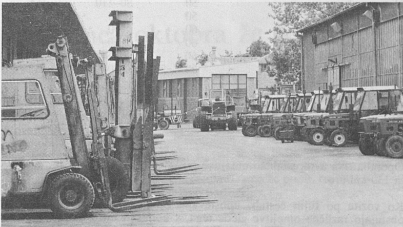
Posnetek kot pohvala. Zakaj, sami presodite