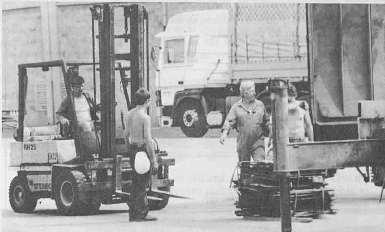
Avgust in začetek septembra sta bila vroča