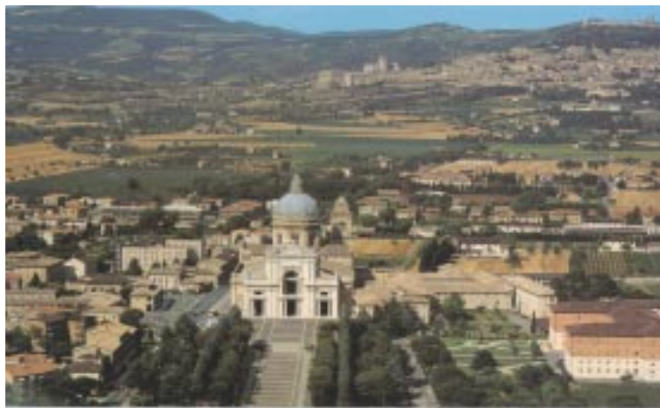
Frančiškovo mesto Assisi z baziliko Svete Marije Angelske - Porcijunkulo v ospredju. Pri Porcijunkuli je Frančišek spoznal poslanstvo svojega življenja, tu je sprejel svoje prve brate in sestro Klaro, tu je v večeru 3. oktobra 1226 sklenil svoje življenje.