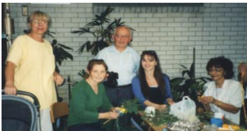
Izdelovanje butaric za cvetno nedeljo. Merrylands, 23. marec 2002