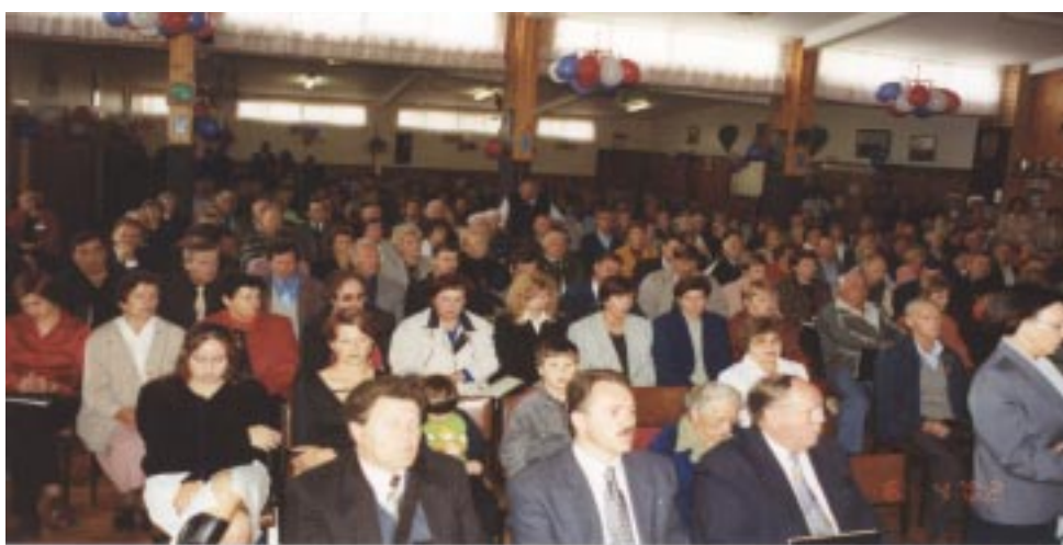
Med sveto mašo ob začetku 8. slovenskega festivala v Geelongu, 6. aprila 2002.