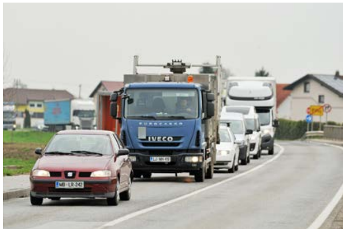
Lani je po tej cesti peljalo skoraj 320.000 težkih tovornjakov.