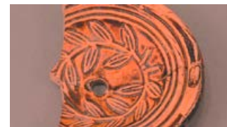
DAN ODPRTIH VRAT ODDELKA ZA POIZKOPALNO OBDELAVO 14. 6., Vičava 5