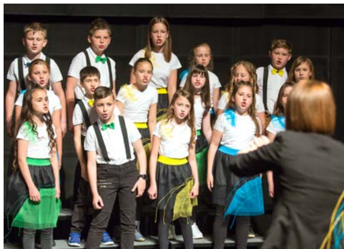
Pevski zbor OŠ Videm, Podružnična šola Leskovec

Letošnji teden se je začel z nacionalnim odprtjem v Murski Soboti 16. maja in se nadaljeval vse do 26. maja z večjimi regijskimi dogodki, ki se povezujejo z več kot tisoč lokalnimi dogodki po Sloveniji. Teden ljubiteljske kulture vsako leto v središče postavi eno od umetniških zvrsti. Letos je osrednjo vlogo prevzel ples in tako so bili številni dogodki plesno obarvani.