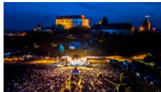
OPERNI VEČER NA PANORAMI 8. 6. ob 20.30 Panorama