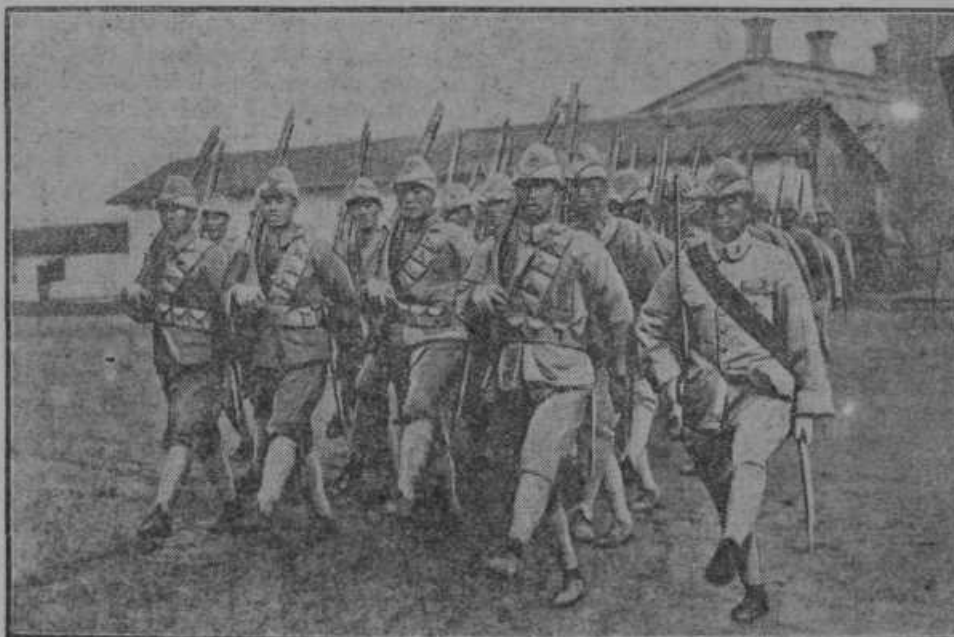
H kitajsko-japonskemu sporu na Daljnem vzhodu. Kitajska severna armada, ki se je borila z Japonci, pri vežbanju.