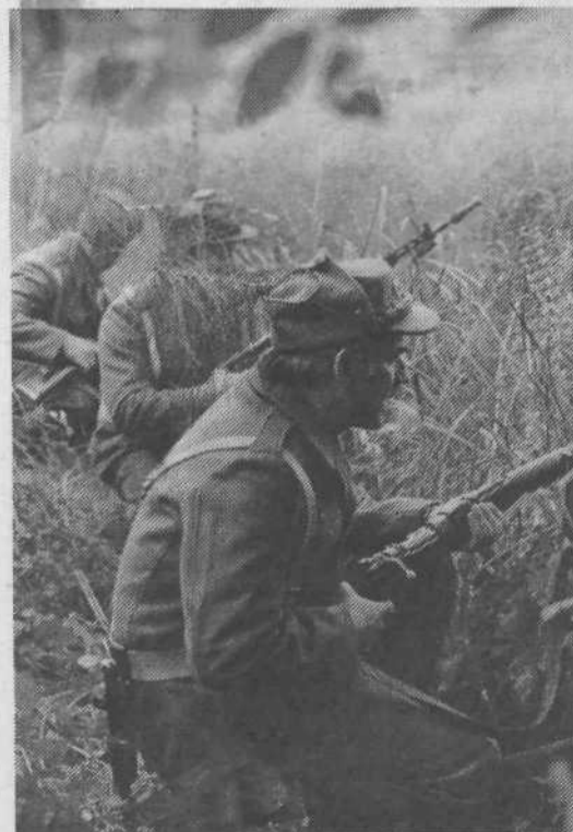
V pričakovanju napada.