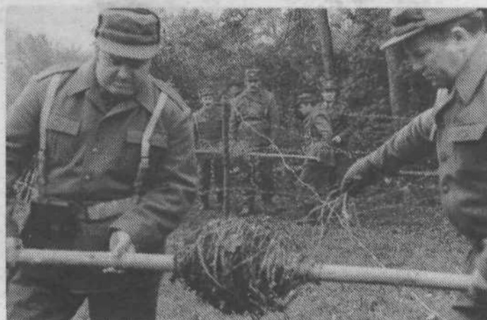
Napadalca je treba onemogočiti z ovirami na vsakem koraku.