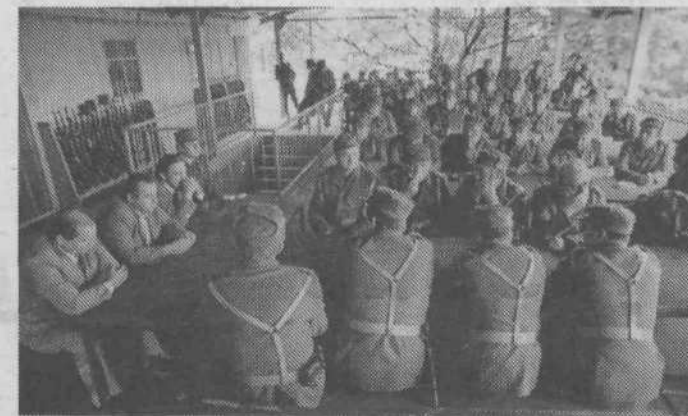
Pogovor s predstavniki občine — predlogi, pobude, pomanjkljivosti...