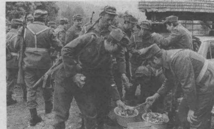
Ob topli malici na terenu še prijeten klepet in analize dosedanjega dela.