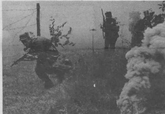
Prodor je uspel.