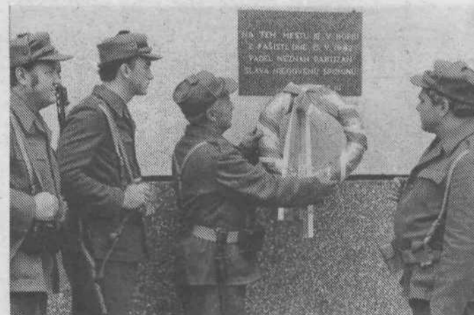
Spominsko obeležje na Domu obrambne vzgoje na Igu, ni in ne bo nikoli pozabljeno.