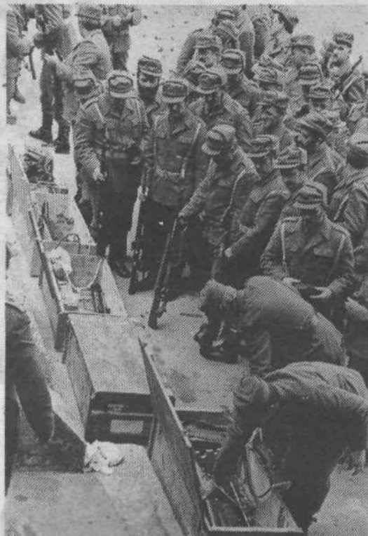
Deli tev osebne oborožitve je potekala bliskovito.