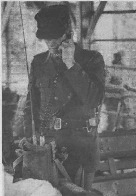
Srce vojaških operacij-komunikacije.