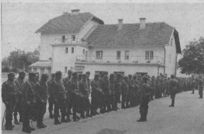
Jutranji zbor pred Domom obrambne vzgoje na Igu.