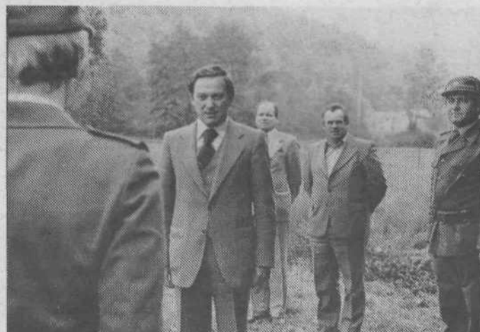
Raport komandirja enote predsedniku občine, ki je s predstavniki občine obiskal enote med samo vajo na terenu.