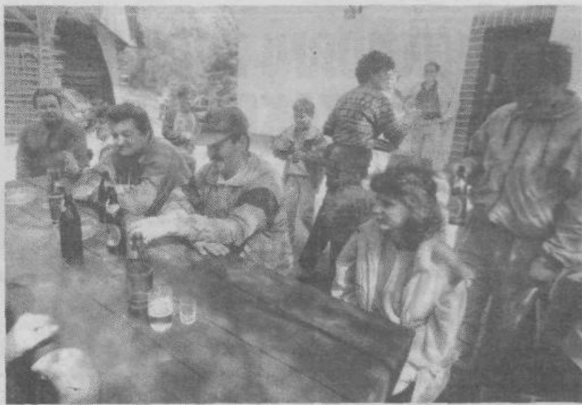
Na Pečarju pri Rezki, prvega maja letos