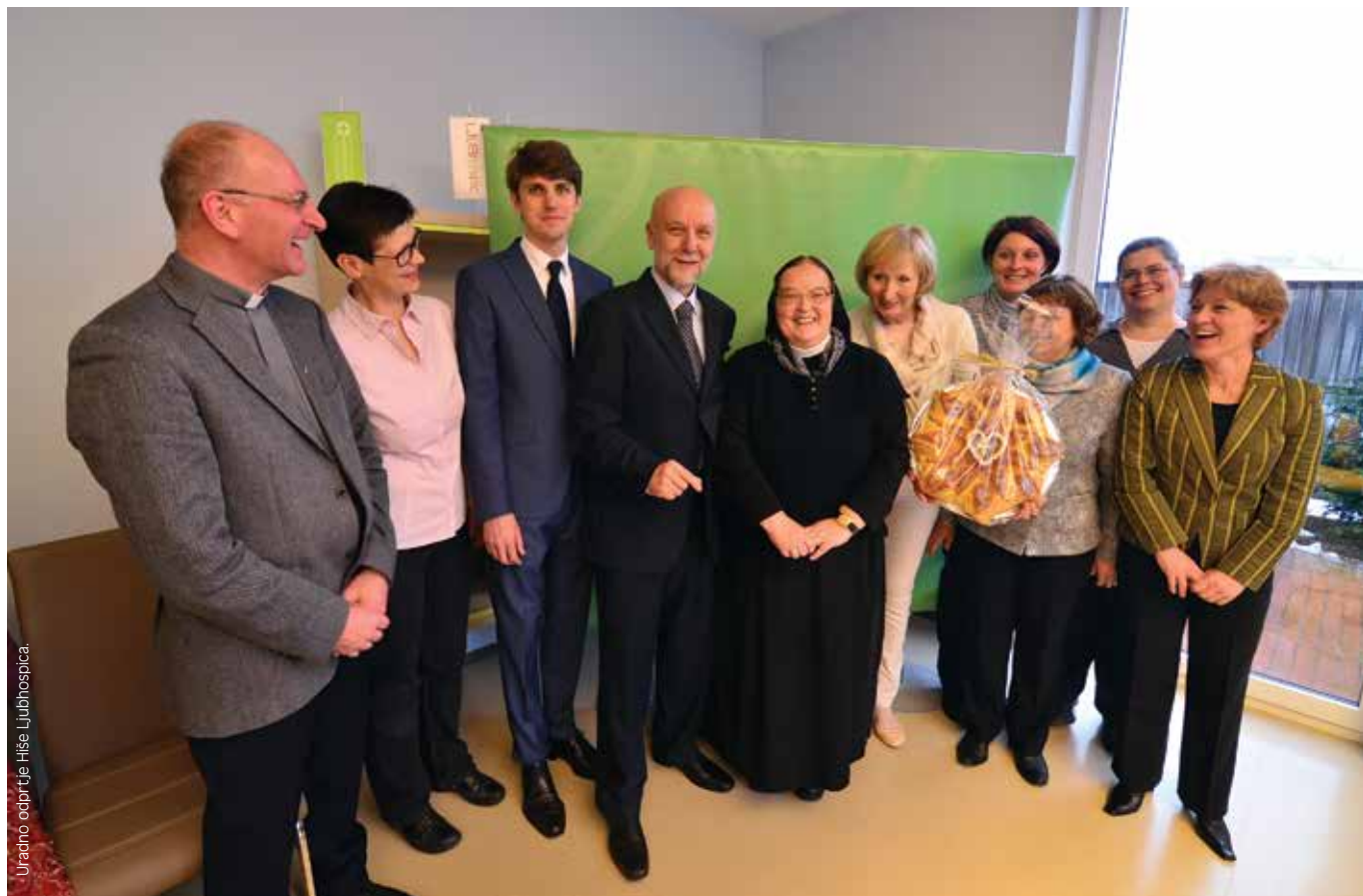
Uradno odprtje hiše Ljubhospica.