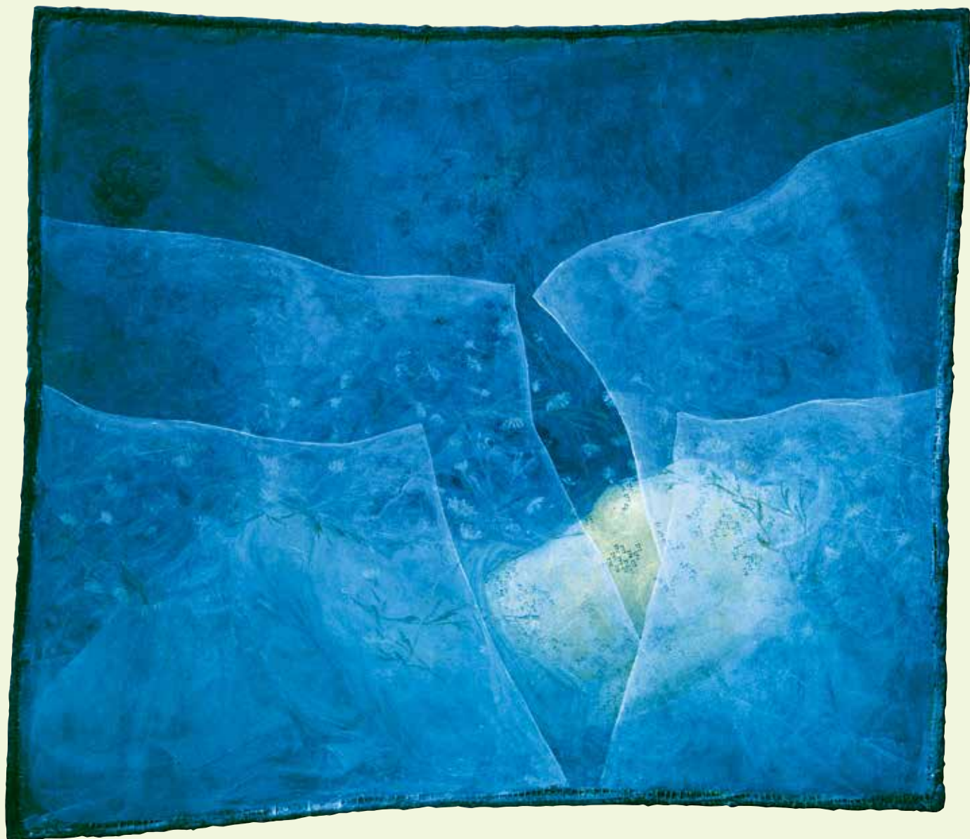
Natalija Šeruga: Z vsemi očmi alkidne in oljne barve na platnu, 143 x 163 cm, 2003, zasebna last